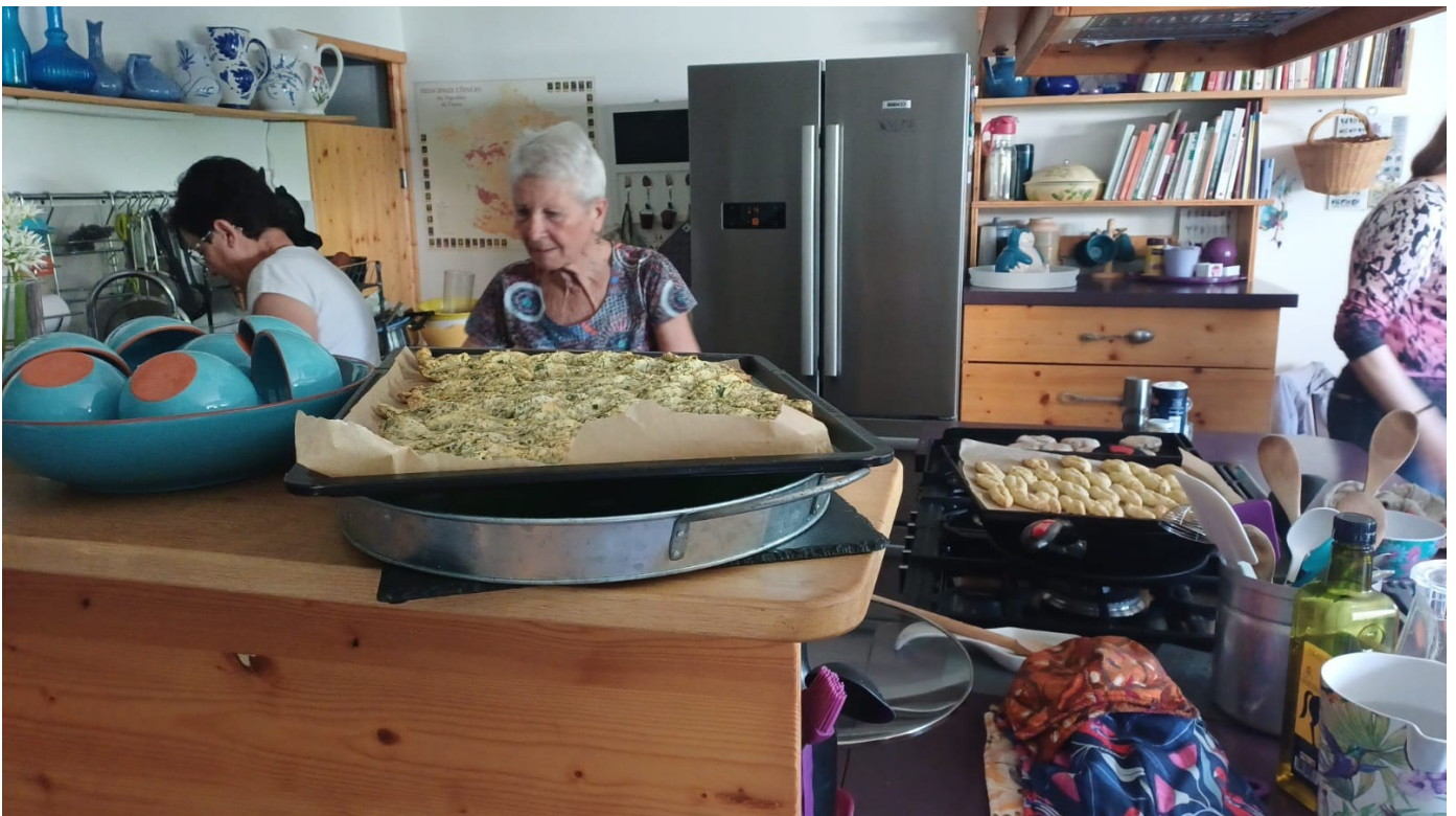
Les pains indiens ou naans partent au four pour la cuisson