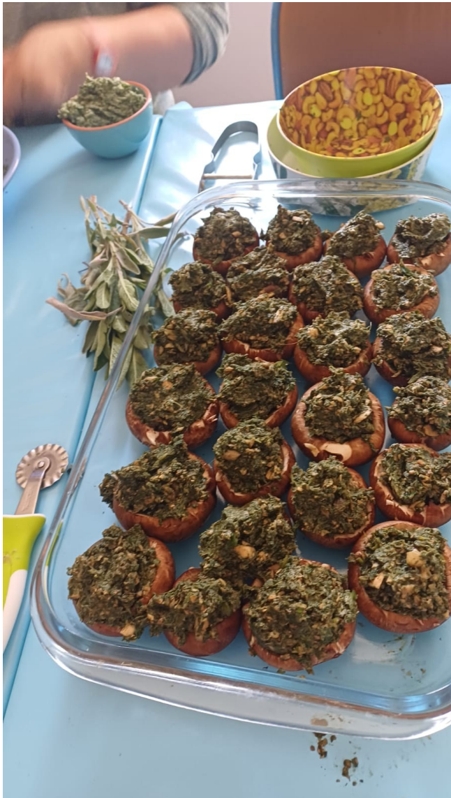
Champignons farcis Orties, armoise, plantain, Rumex, berce épiaire