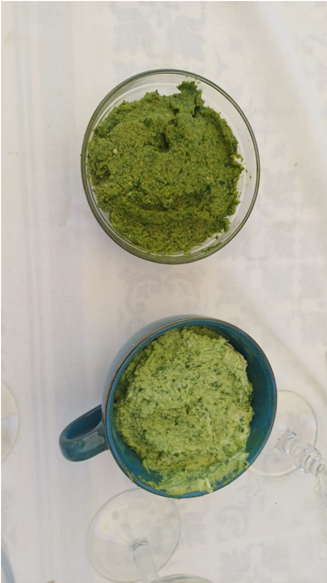
Tapenade verte et tartinaade verte ail des ours