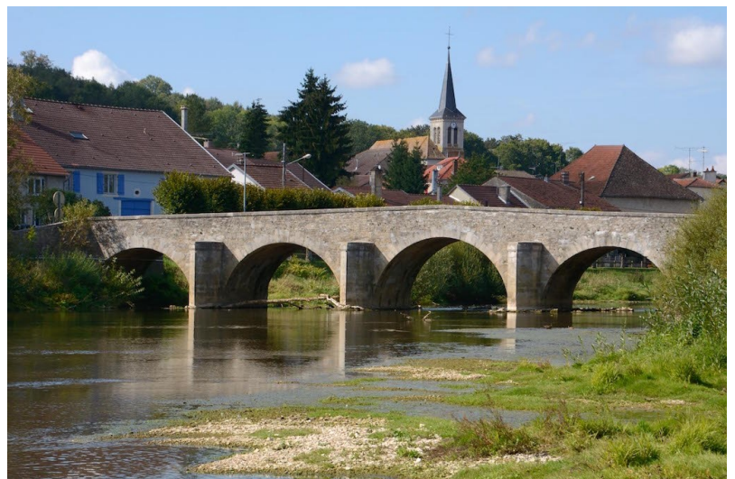
Le pont de Frébécourt