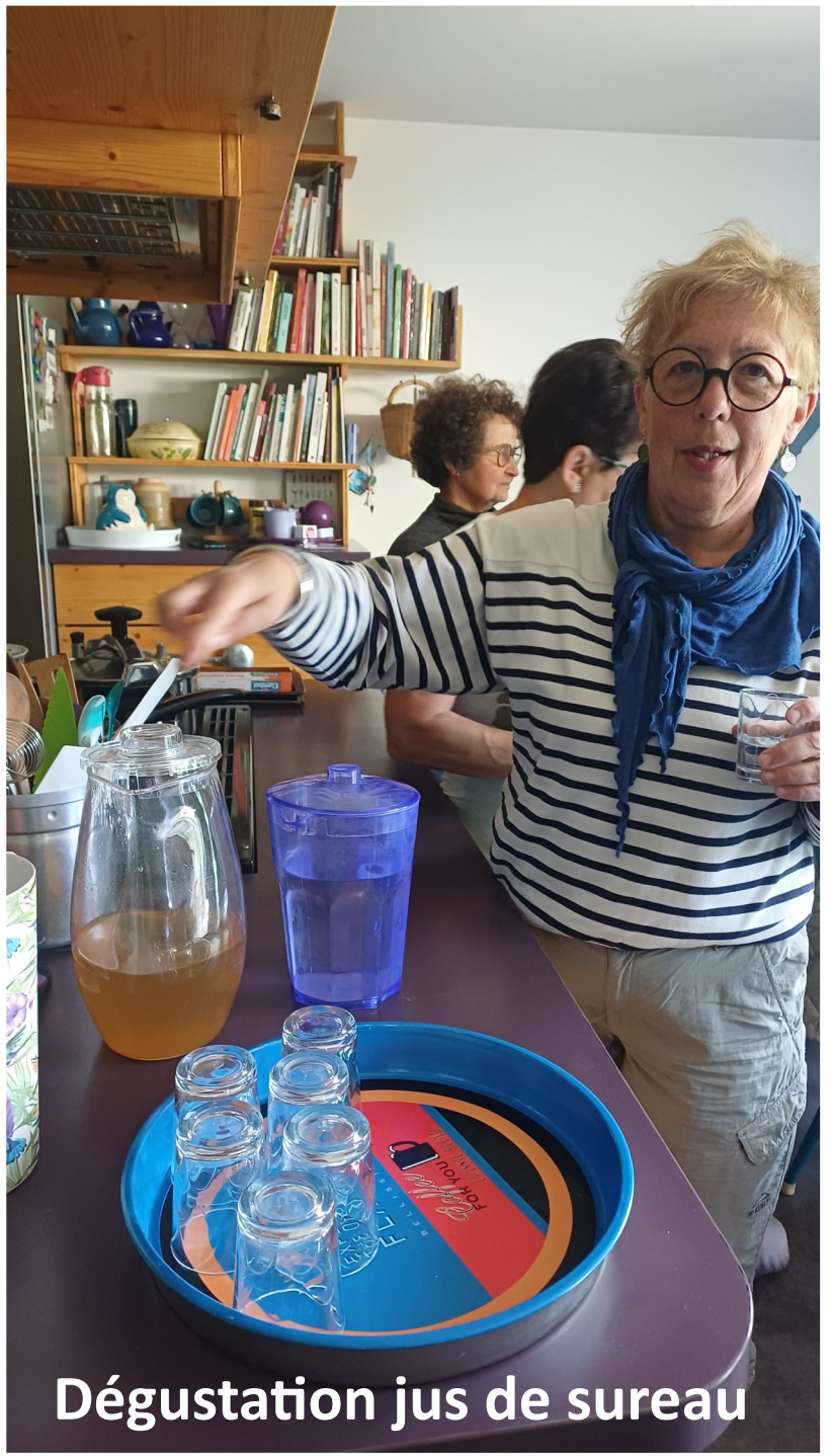
Dégustation jus de sureau