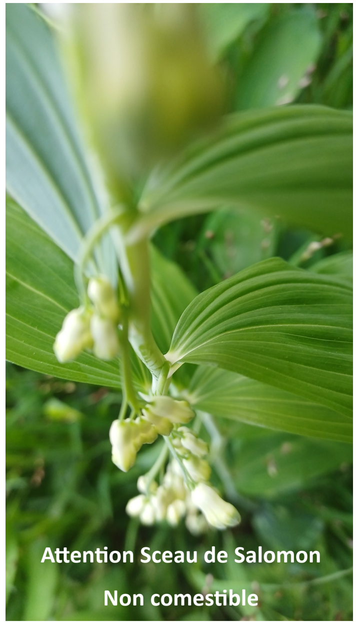
Attention Sceau de Salomon Non comestible