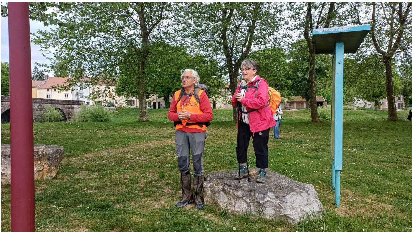
Discours de bienvenue de la présidente de l'Astragale et du secrétaire de Charmes