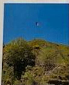
Vue panoramique sur Remiremont