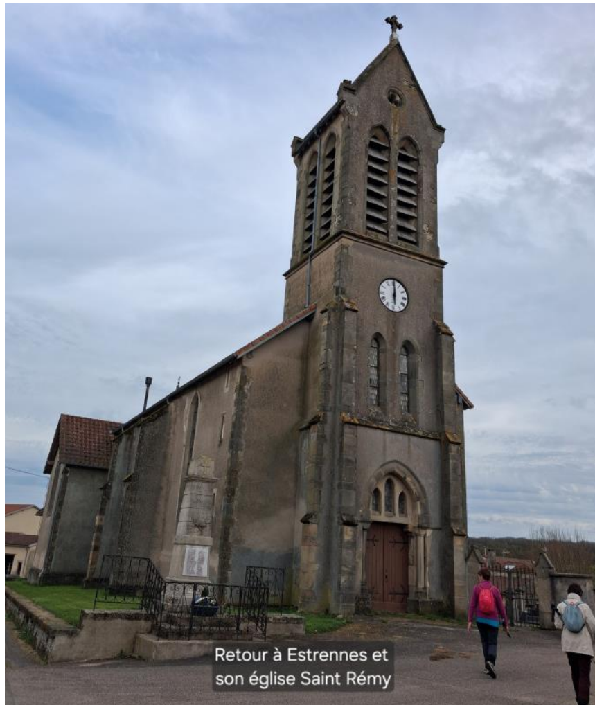
Retour à Estrennes et son église Saint Rémy