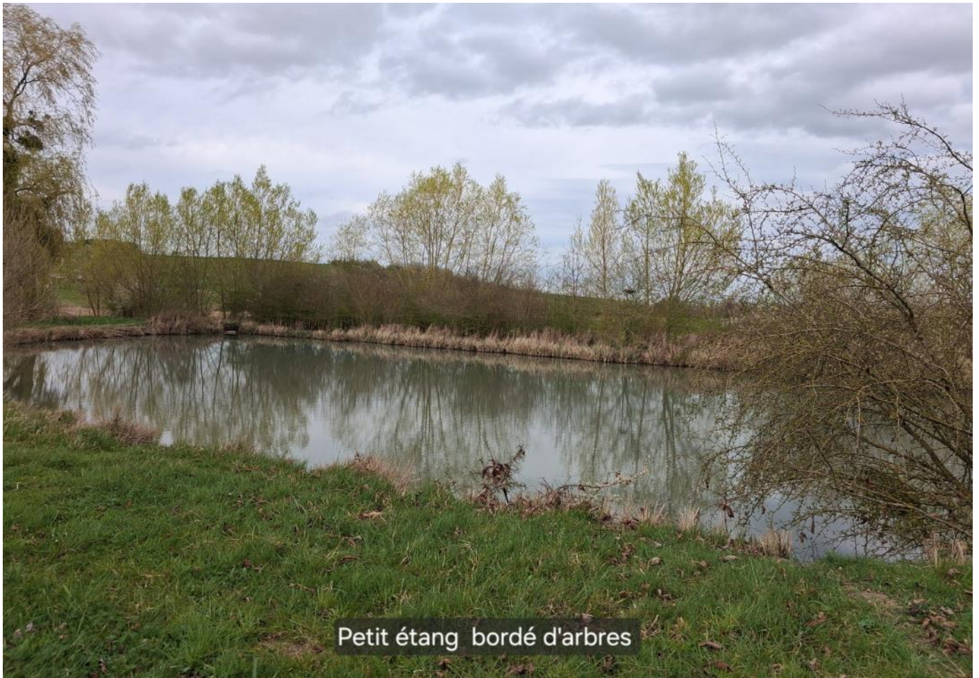
Petit étang bordé d'arbres