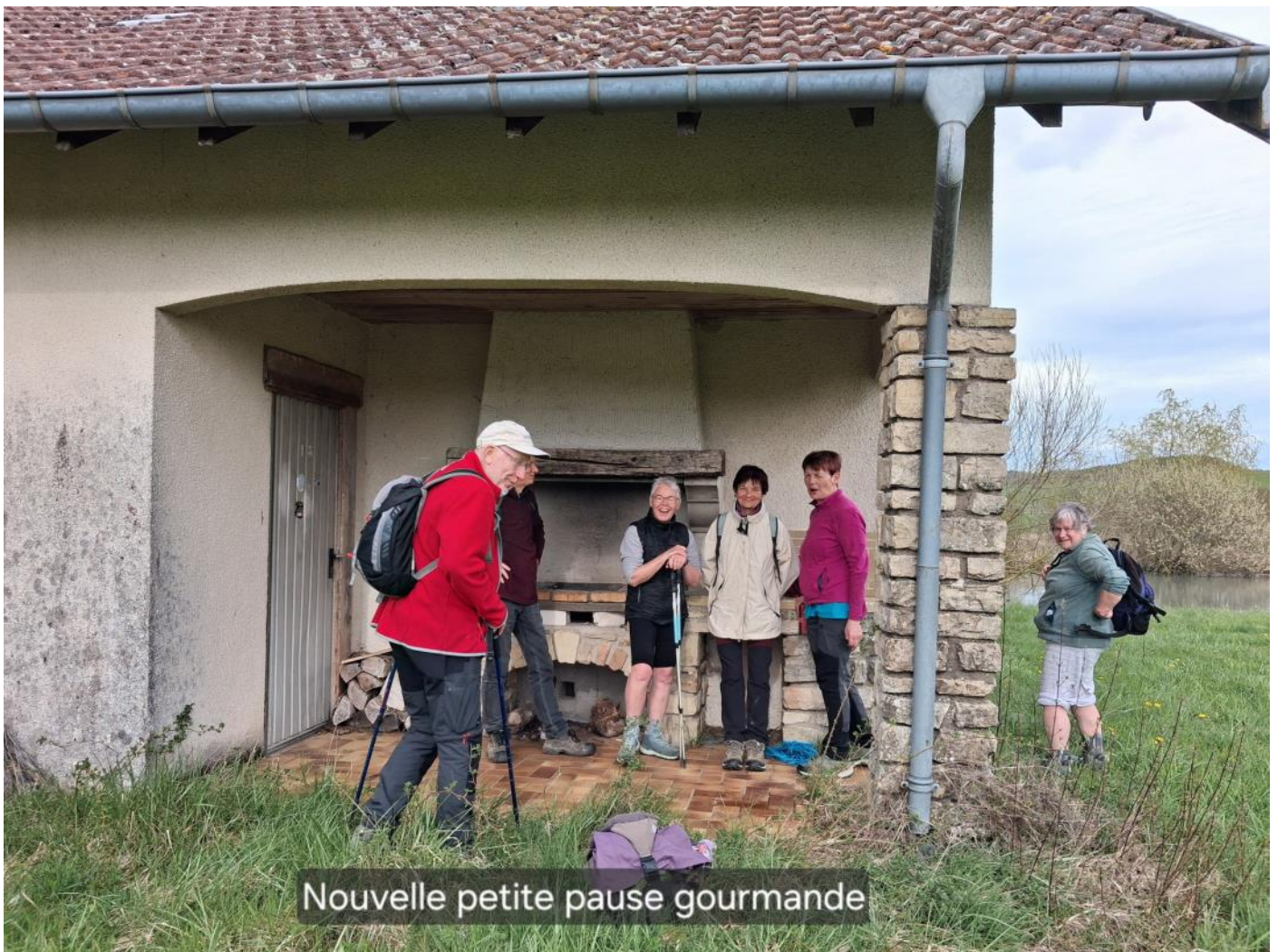
Nouvelle petite pause gourmande