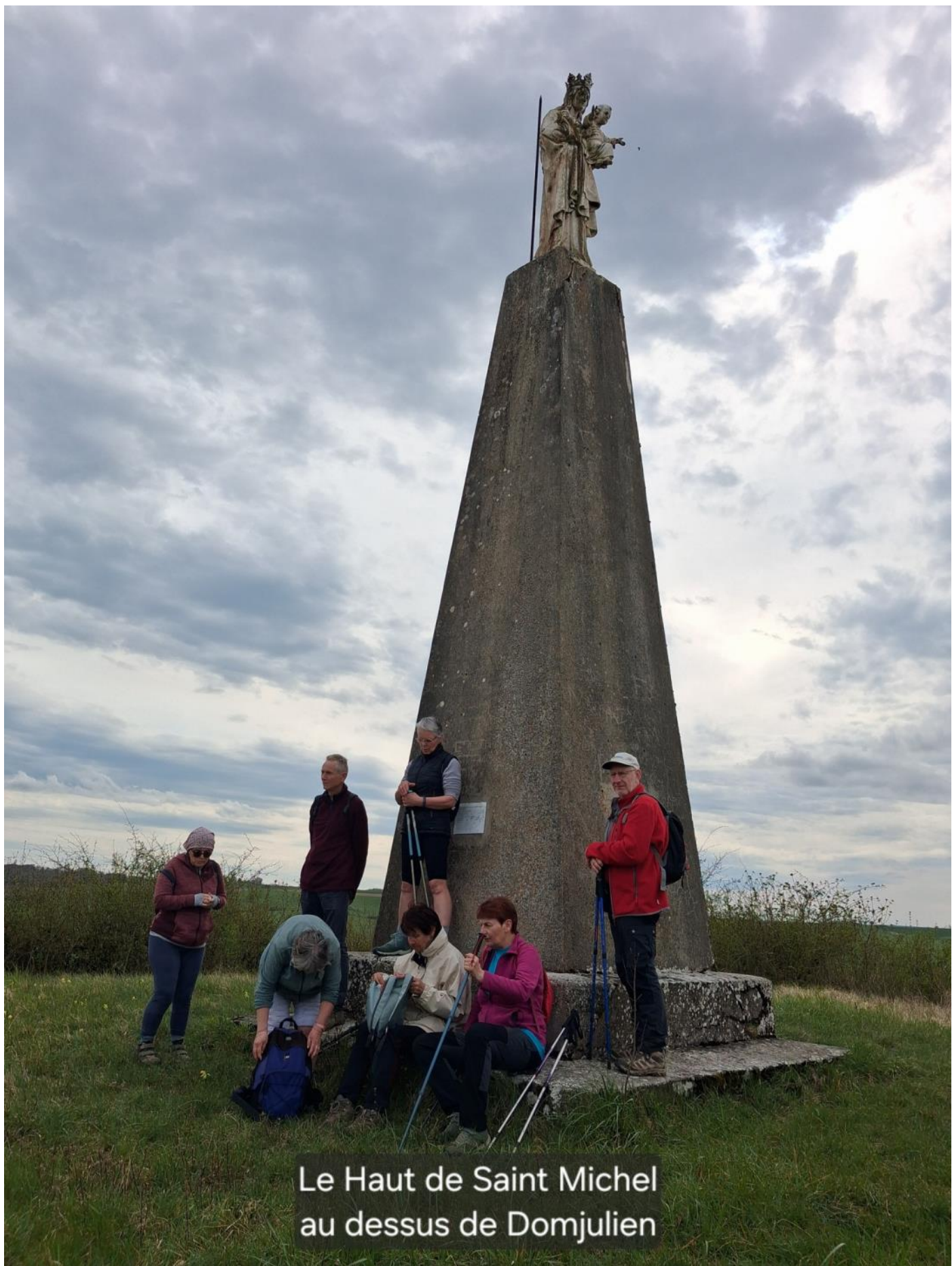
Le Haut de Saint Michel au dessus de Domjulien