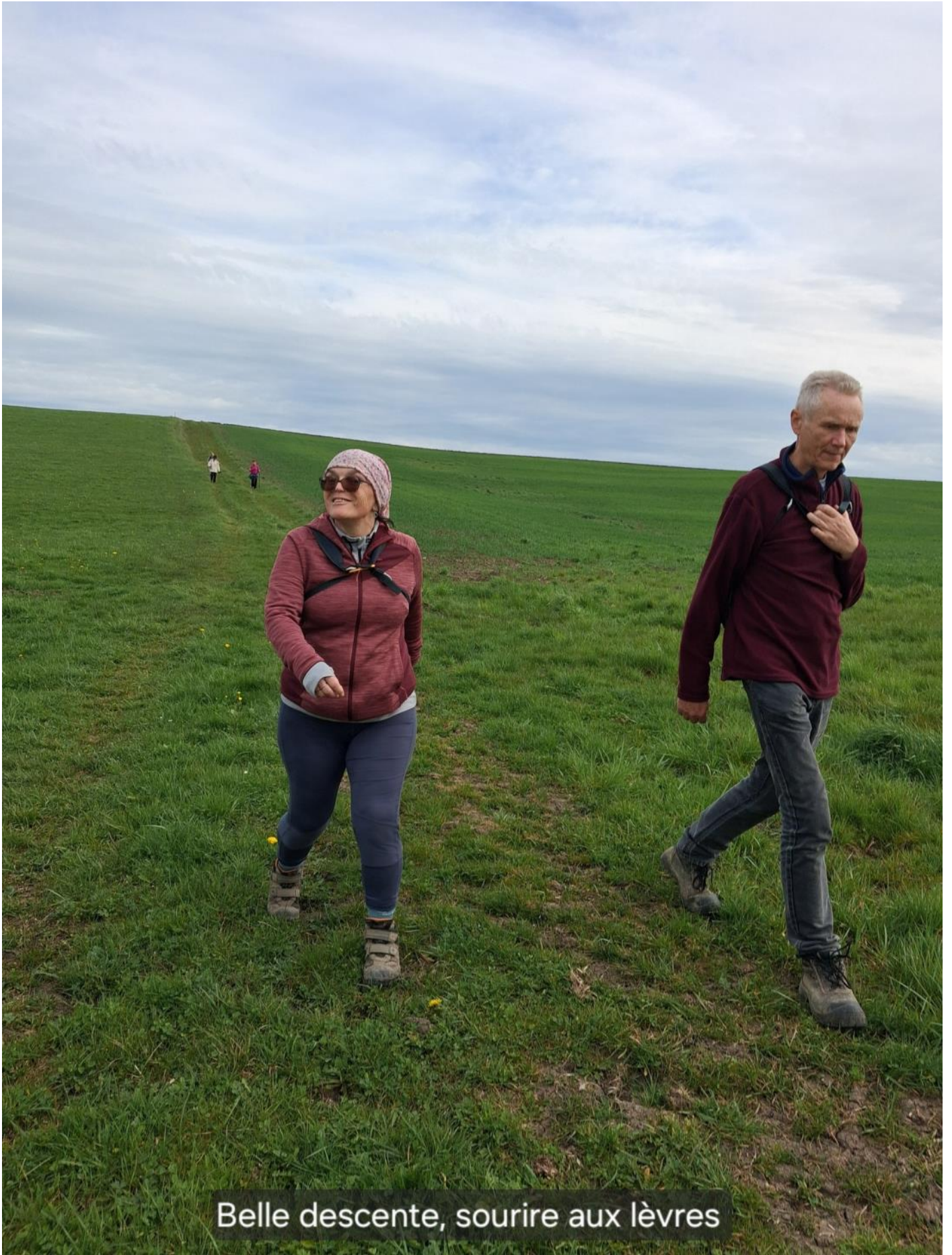
Belle descente, sourire aux lèvres