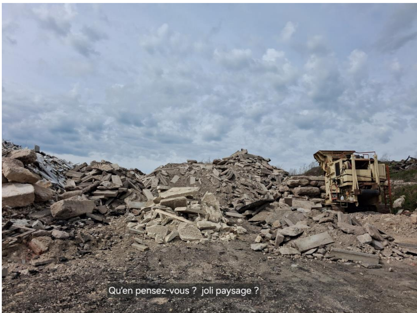
Qu'en pensez-vous ? joli paysage ?