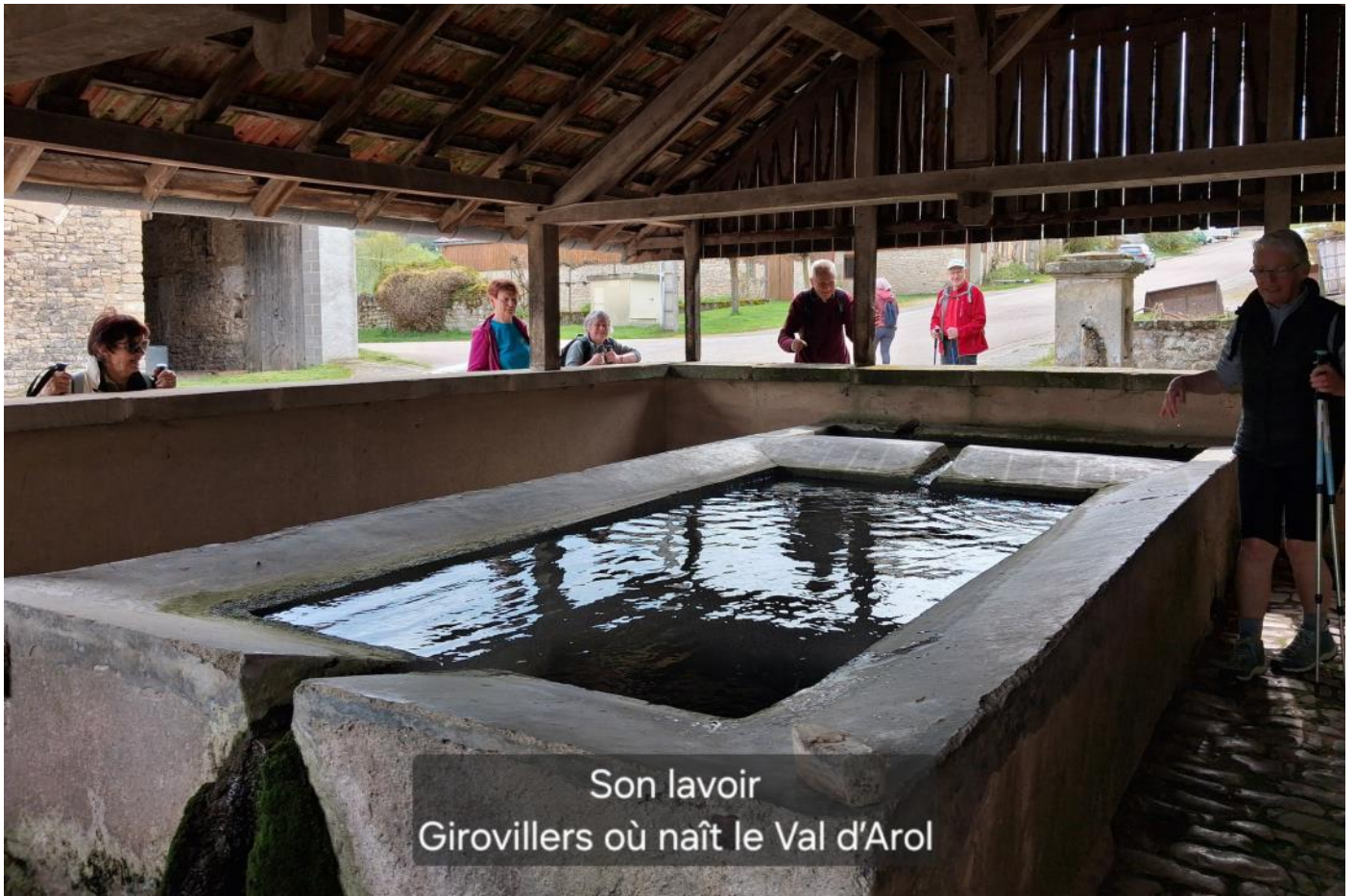
Son lavoir Girovillers où naît le Val d'Arol