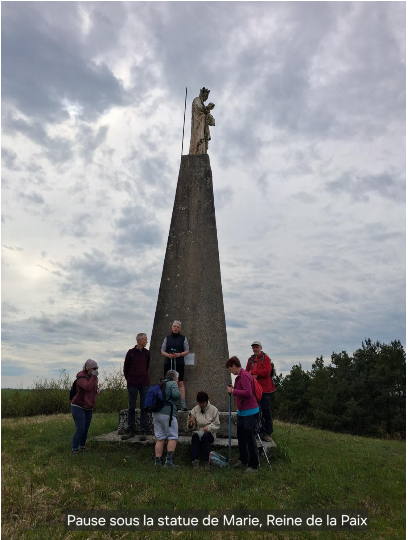
Pause sous la statue de Marie, Reine de la Paix