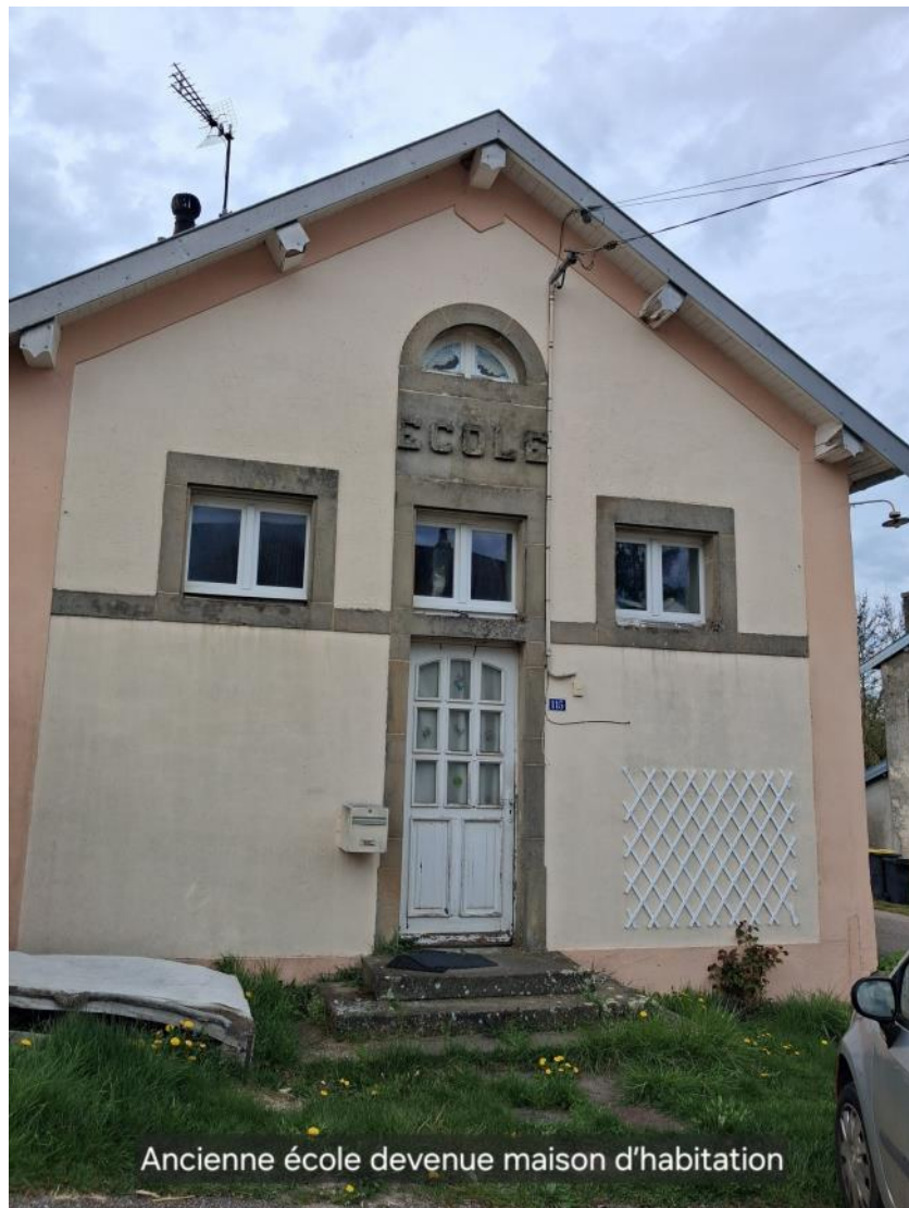
Ancienne école devenue maison d'habitation