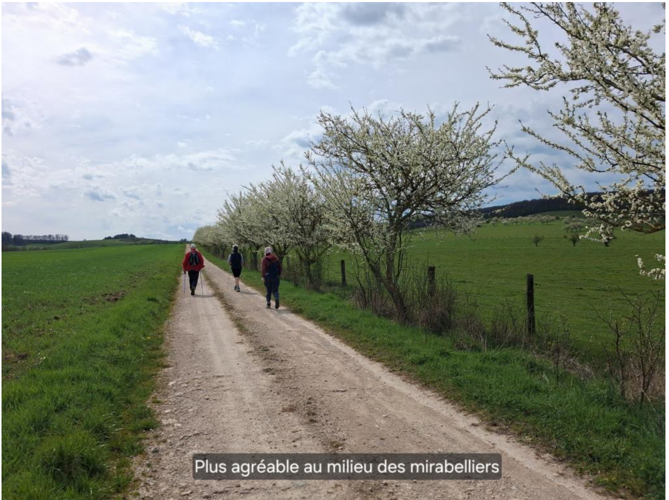
Plus agréable au milieu des mirabelliers