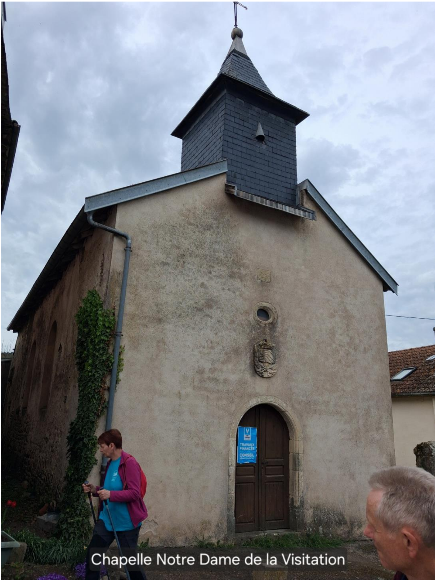
Chapelle Notre Dame de la Visitation