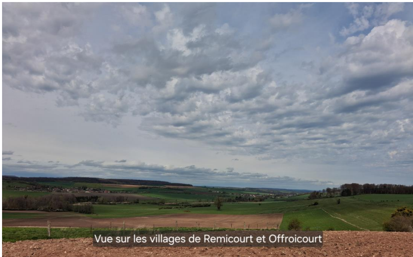
Vue sur les villages de Remicourt et Offroicourt