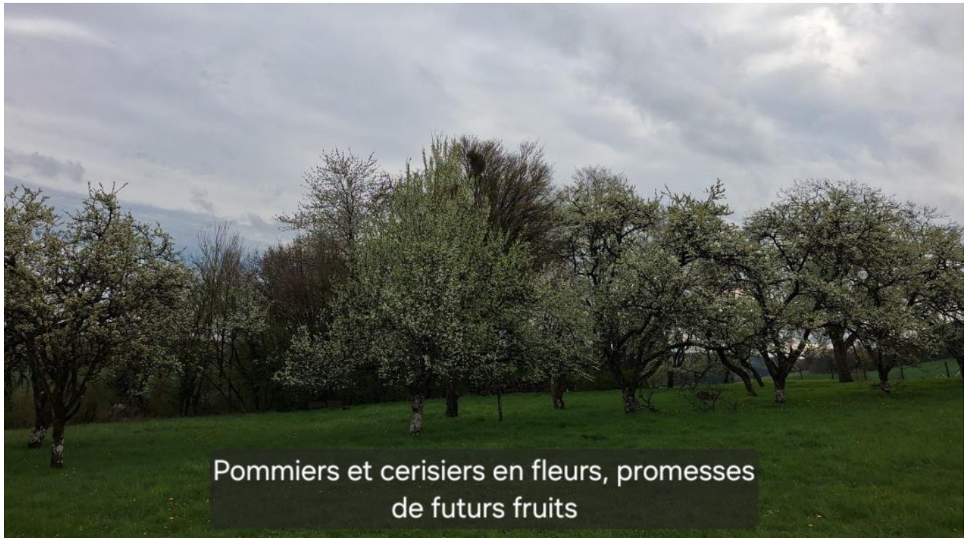
Pommiers et cerisiers en fleurs, promesses de futurs fruits