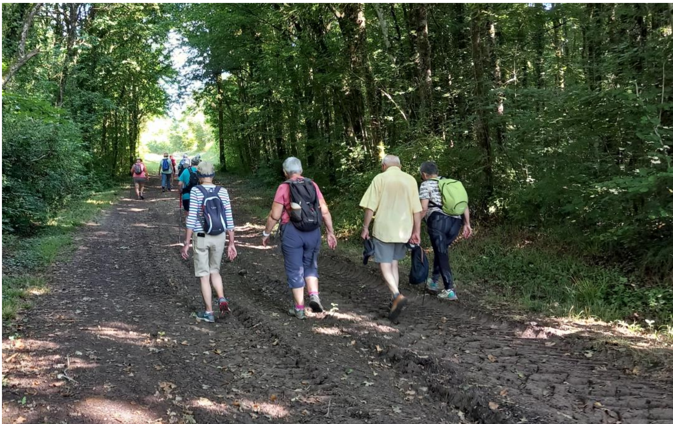
Novembre 2025 à MIRECOURT