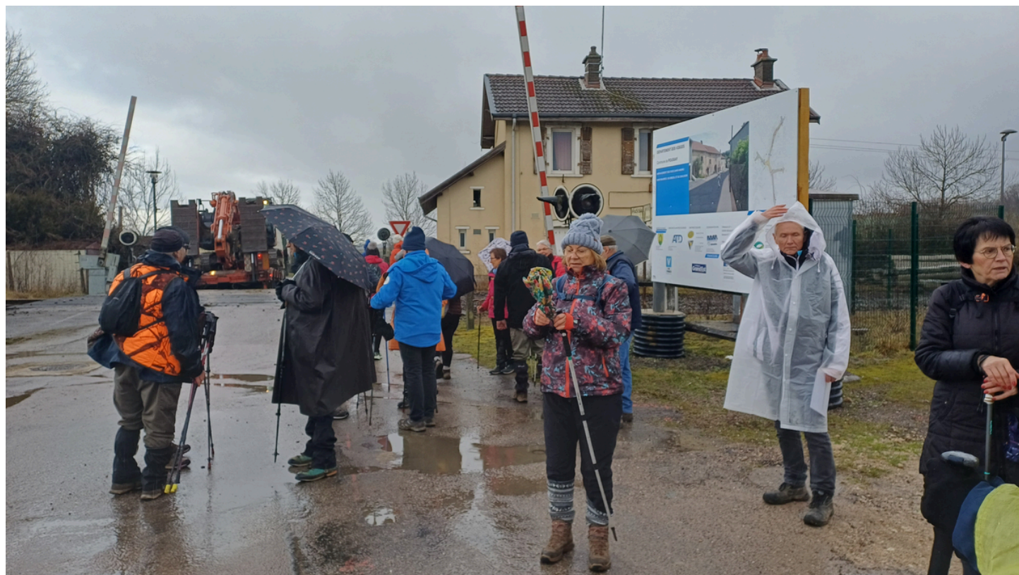
ancienne gare de POUSSAY