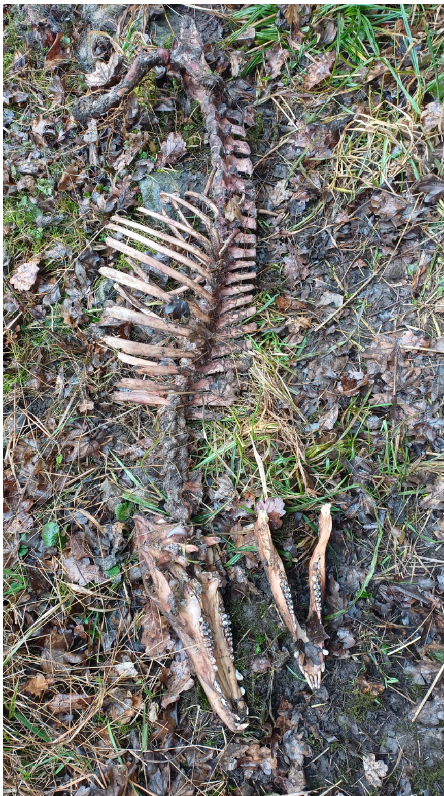
Squelette de putois