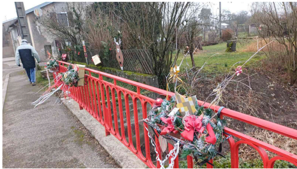
Boite à lettres personnalisée