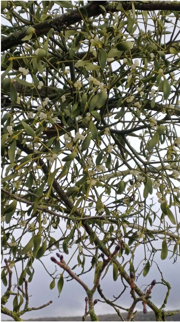
Le gui attend d'être cueilli pour l'an 2026