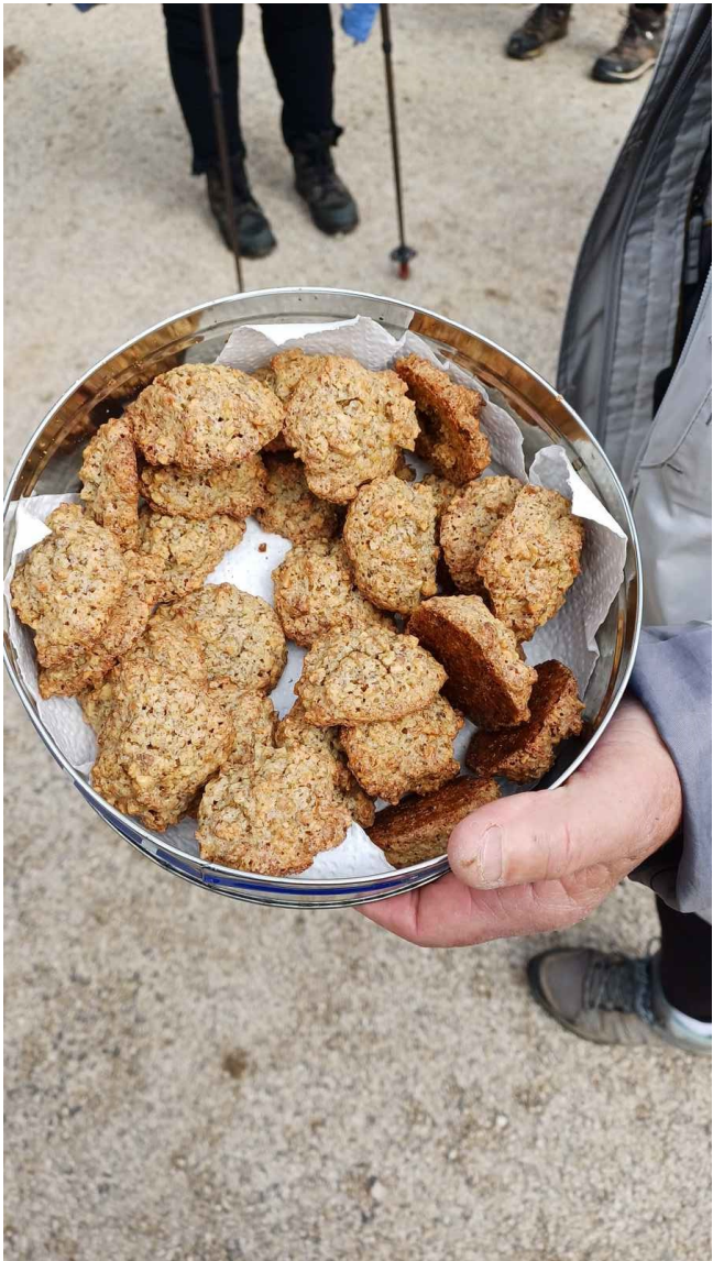
Les douceurs de la balade, merci Noëlle