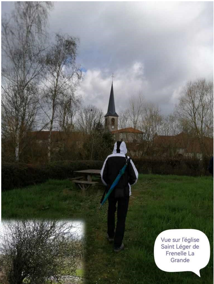
Vue sur l'église Saint Léger de Frenelle La Grande