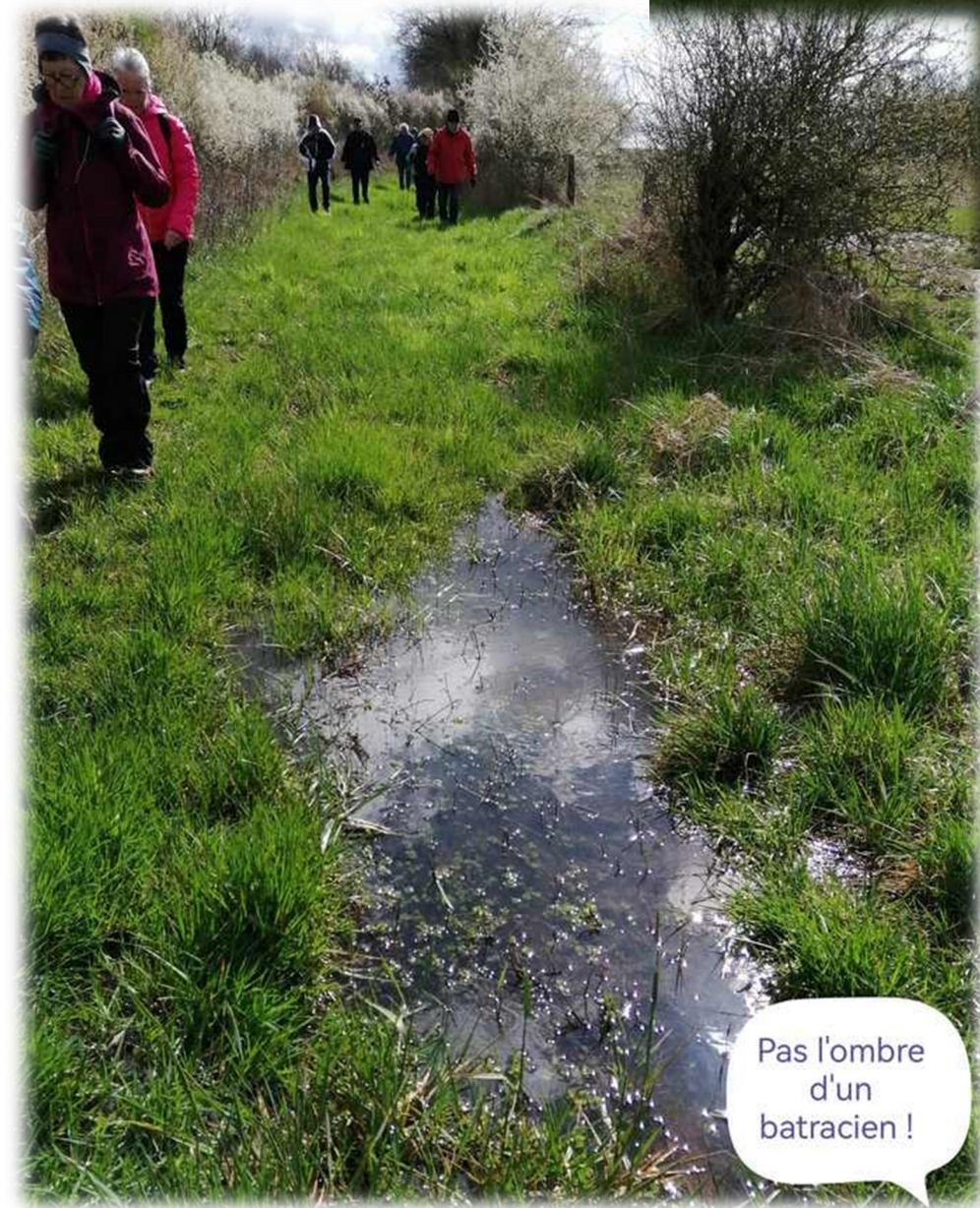
Pas l'ombre d'un batracien !