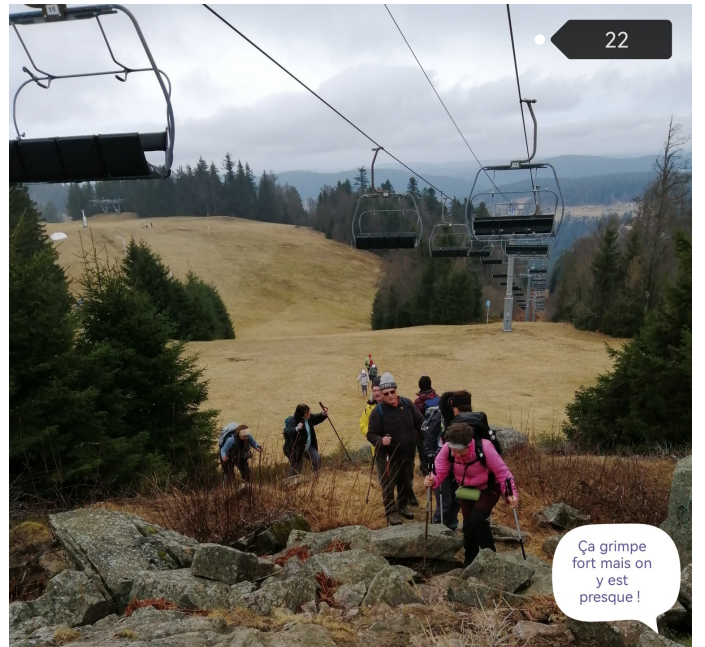
Ça grimpe fort mais on y est presque !