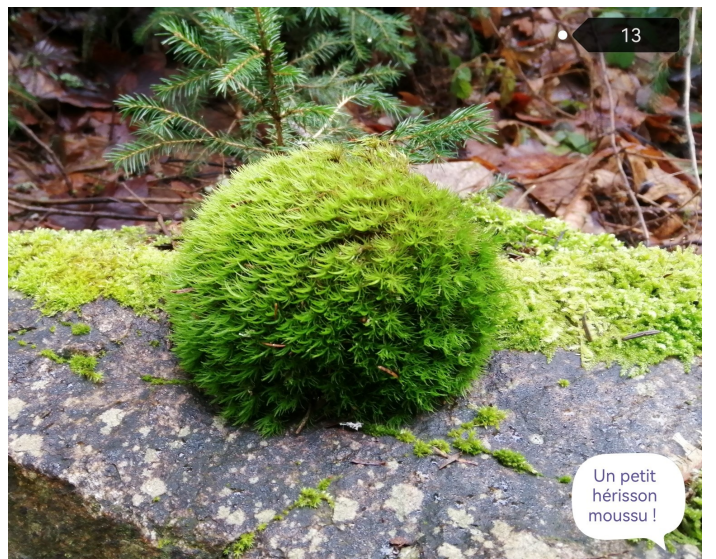
Un petit hérisson moussu !