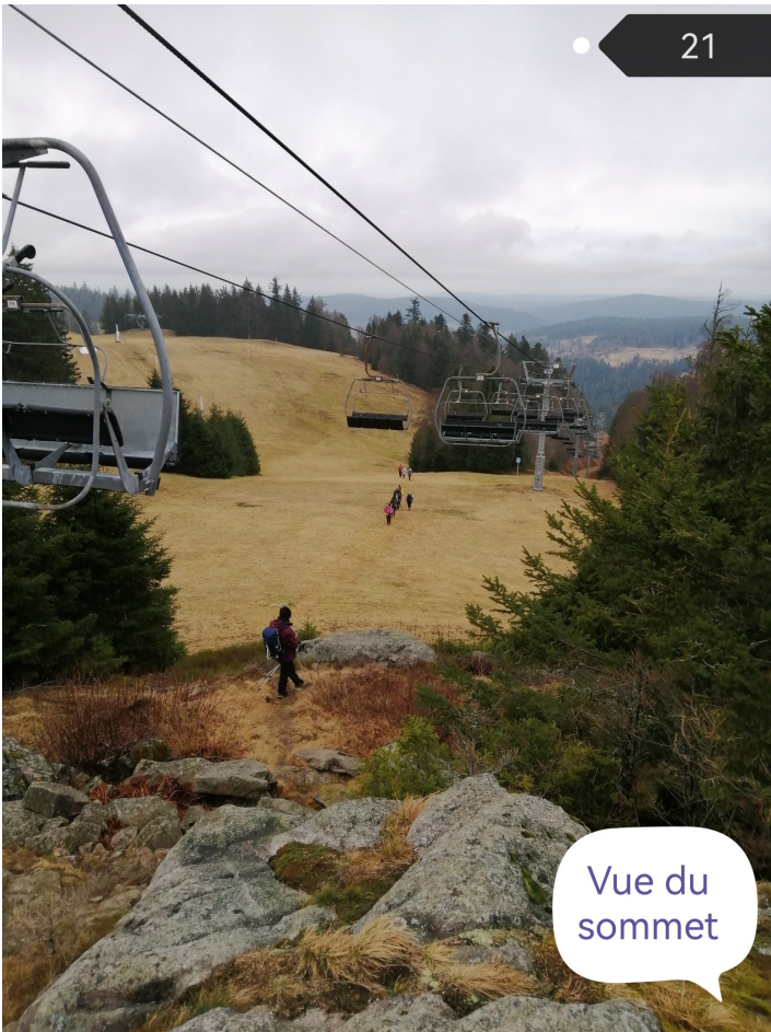
Vue du sommet