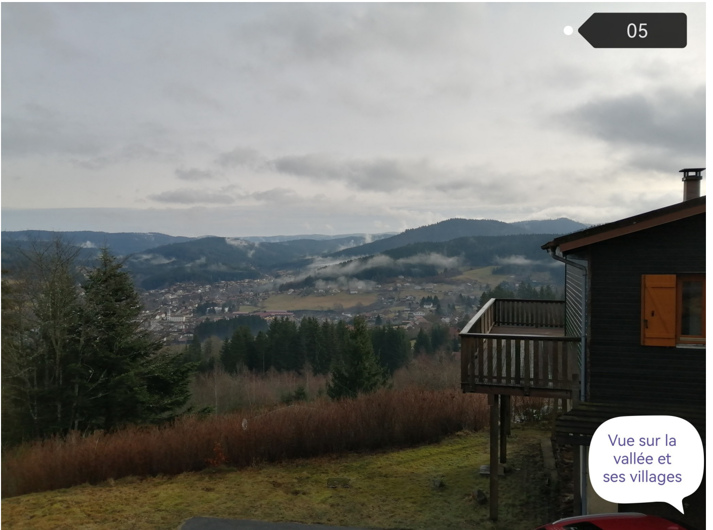
Vue sur la vallée et ses villages