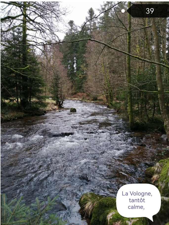
La Vologne, tantôt calme,