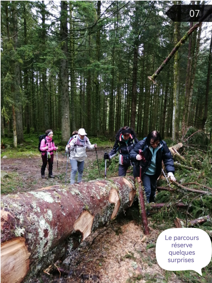
Le parcours réserve quelques surprises