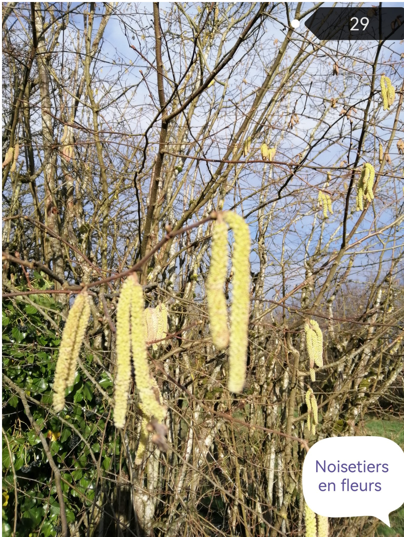
Noisetiers en fleurs