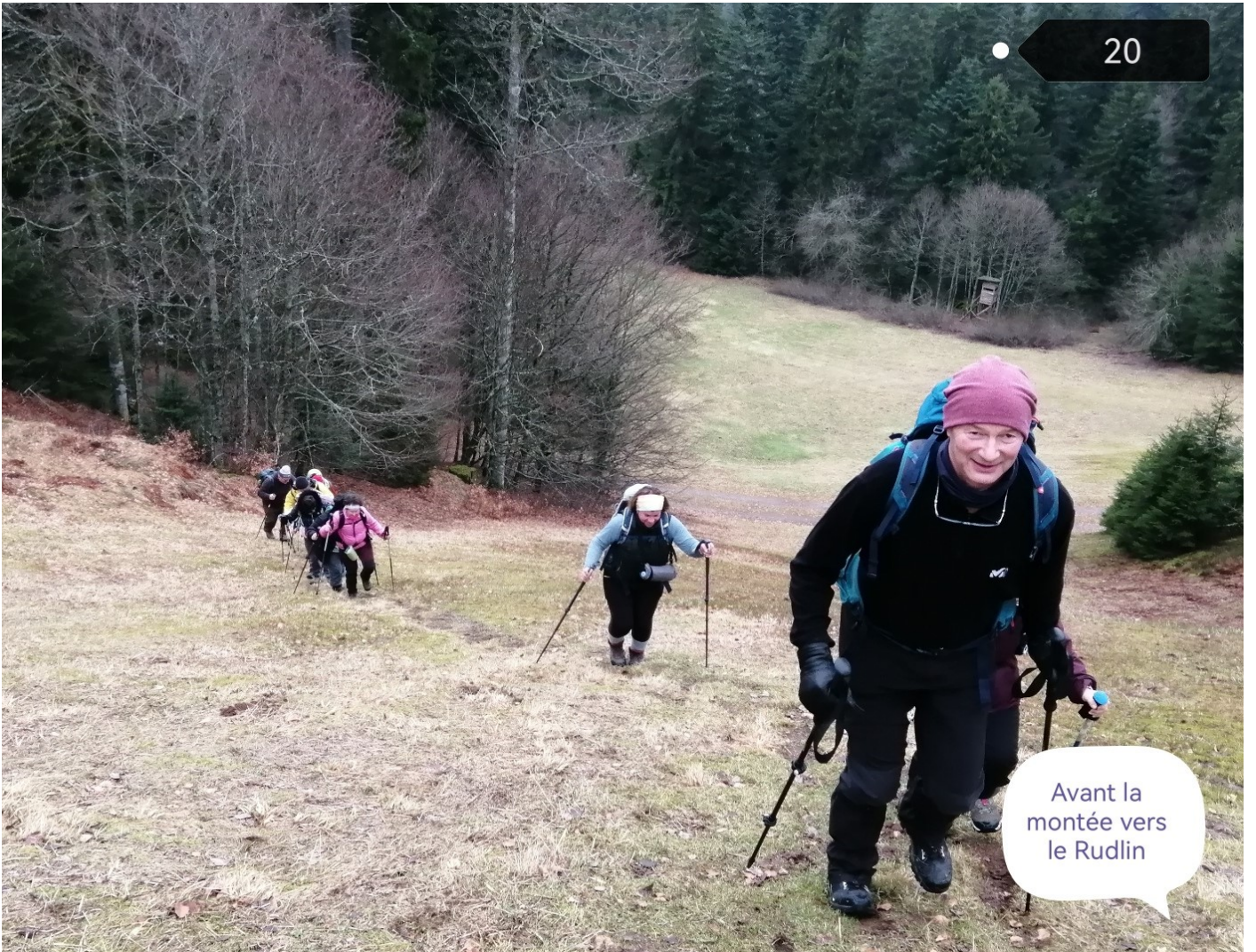
Avant la montée vers le Rudlin