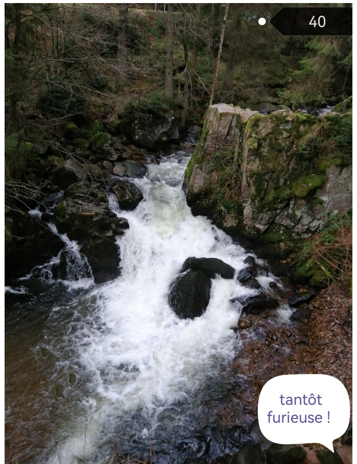
tantôt furieuse !