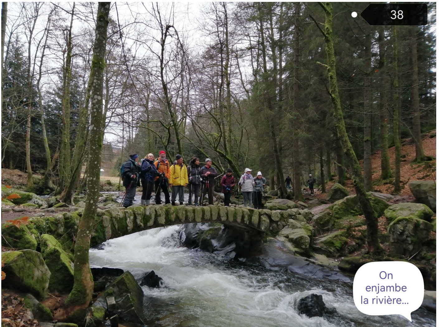
On enjambe la rivière...