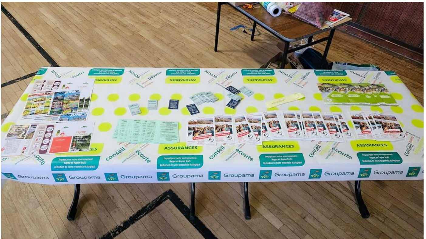
Affichage des cartes des trois parcours, des numéros d'appel (Urgence médicale, Pompiers, Gendarmerie, Présidente et Secrétaire de L'Astragale