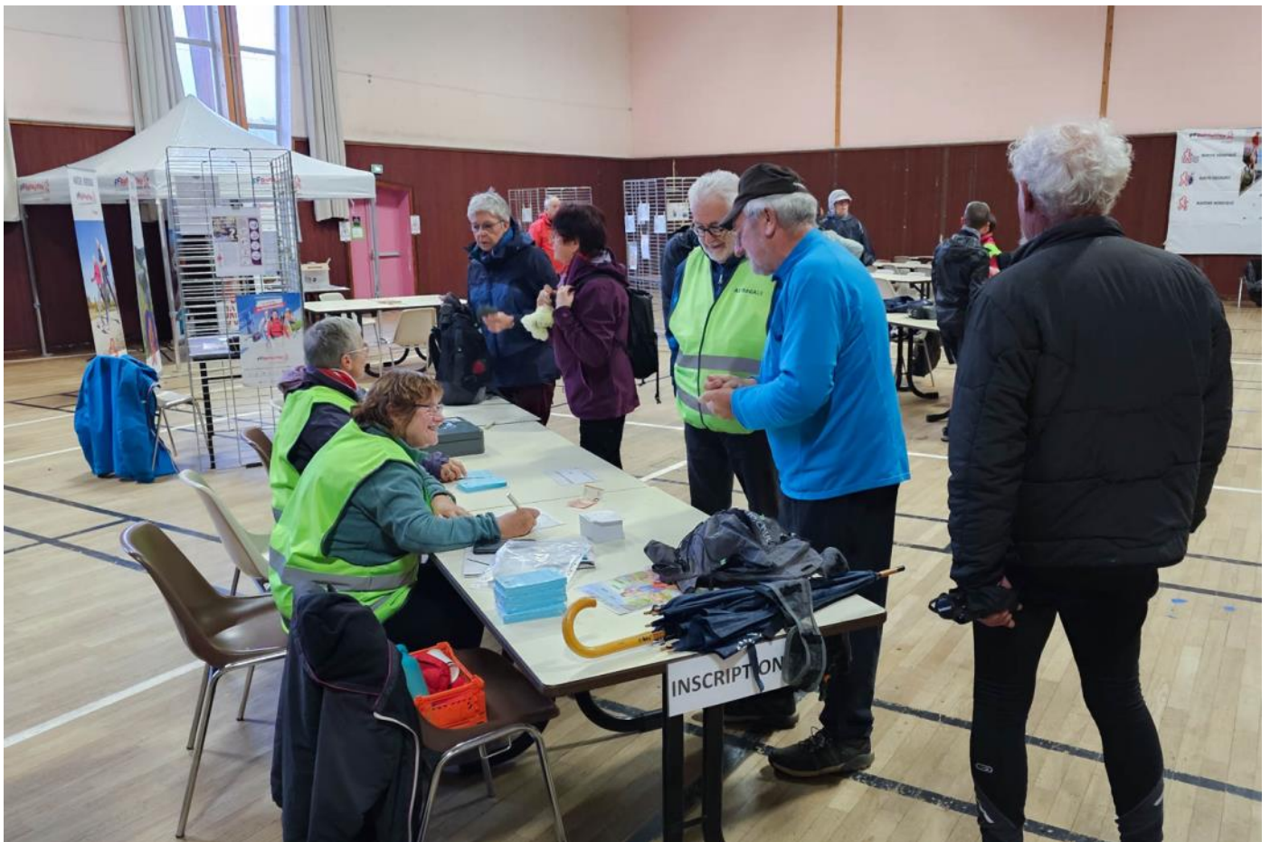
Les autres club FFRP des Vosges sont représentés : les Copains Baladeurs de Hadol, les Béréts Randonneurs de Plainfaing, les Randonneurs du Pays de Charmes.