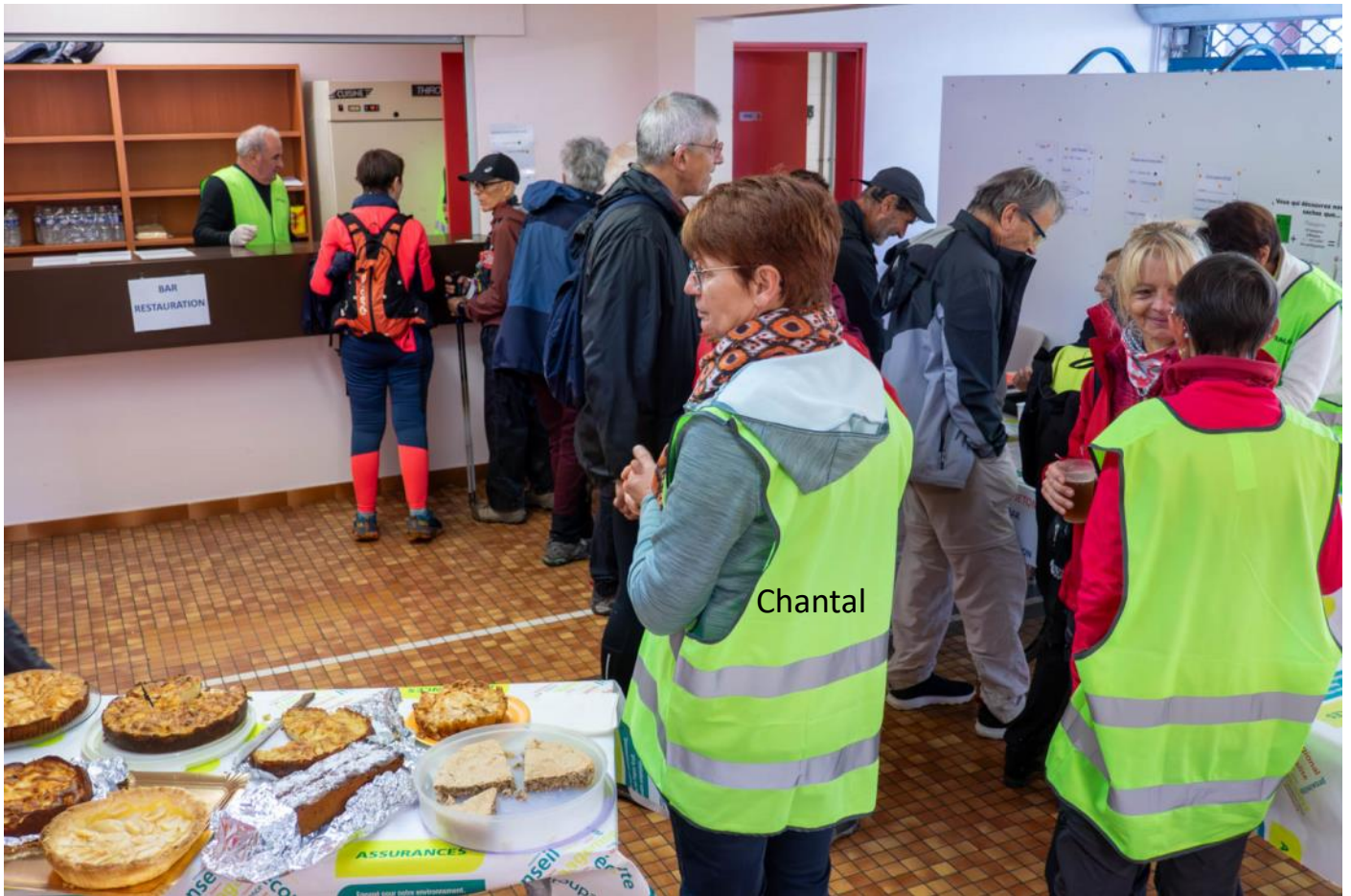
Avant de retourner sur le terrain , je prends de nouvelles photos de l'accueil et des inscriptions.