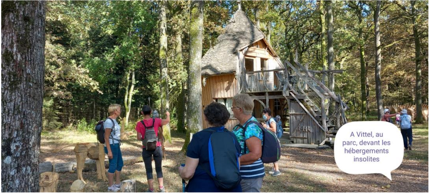
A Vittel, au parc, devant les hébergements insolites