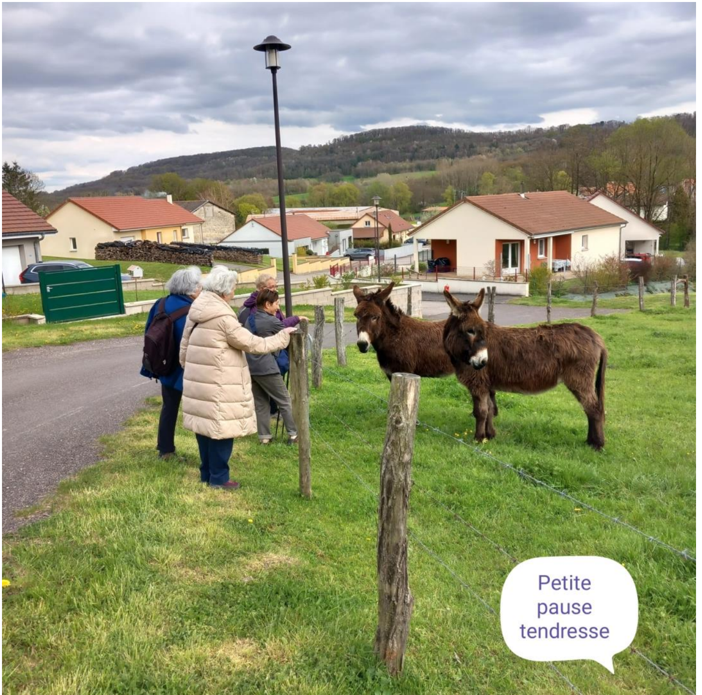
Petite pause tendresse