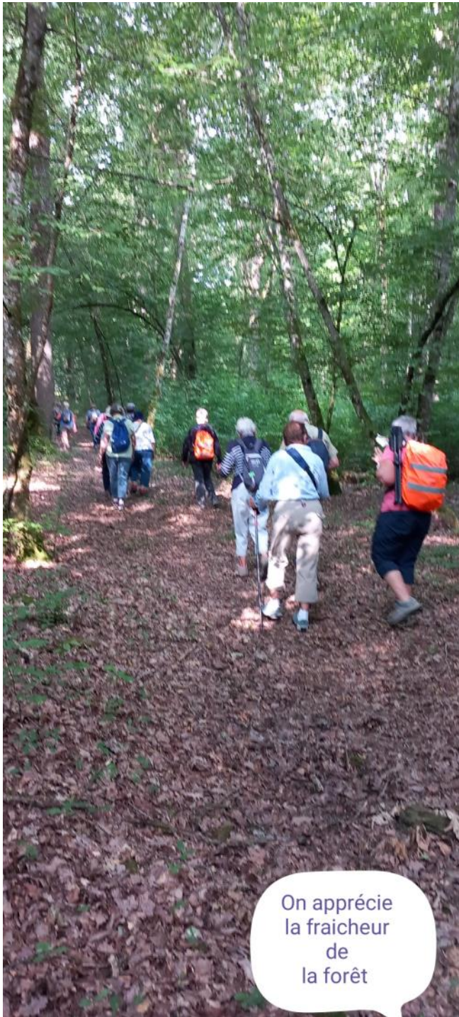
On apprécie la fraîcheur de la forêt