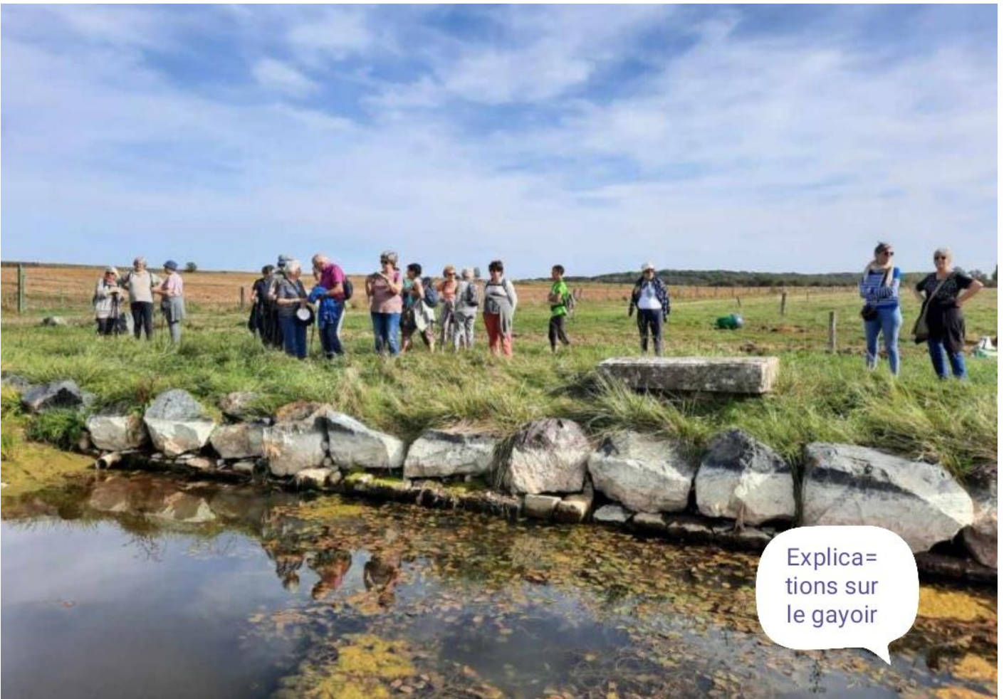
Explica= tions sur le gayoir