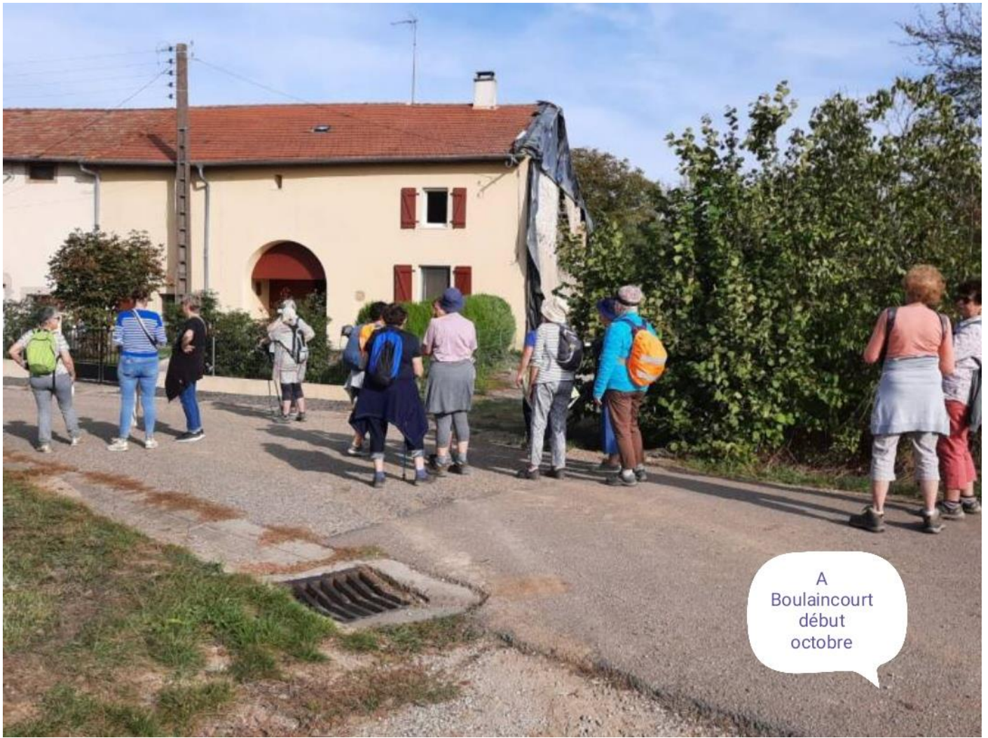
A Boulaincourt début octobre