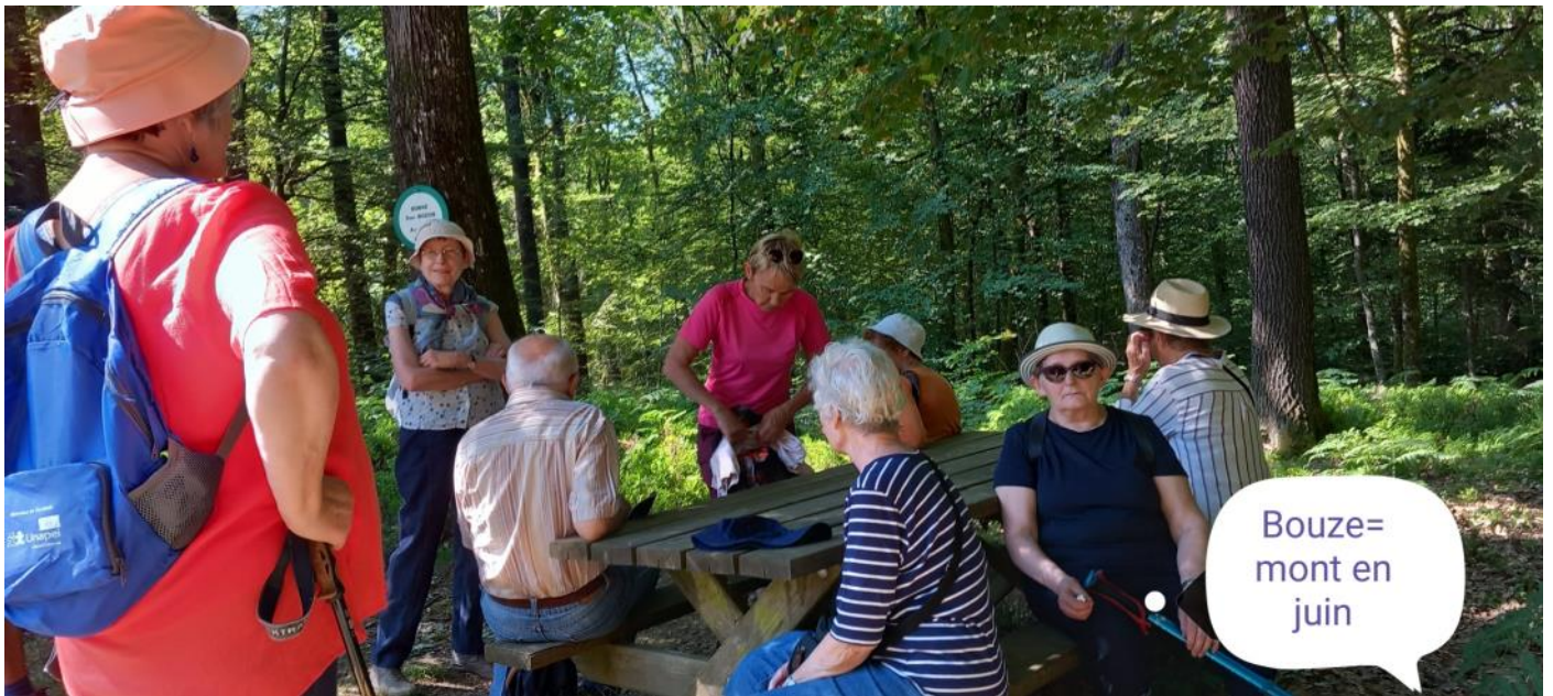
Bouze=mont en juin