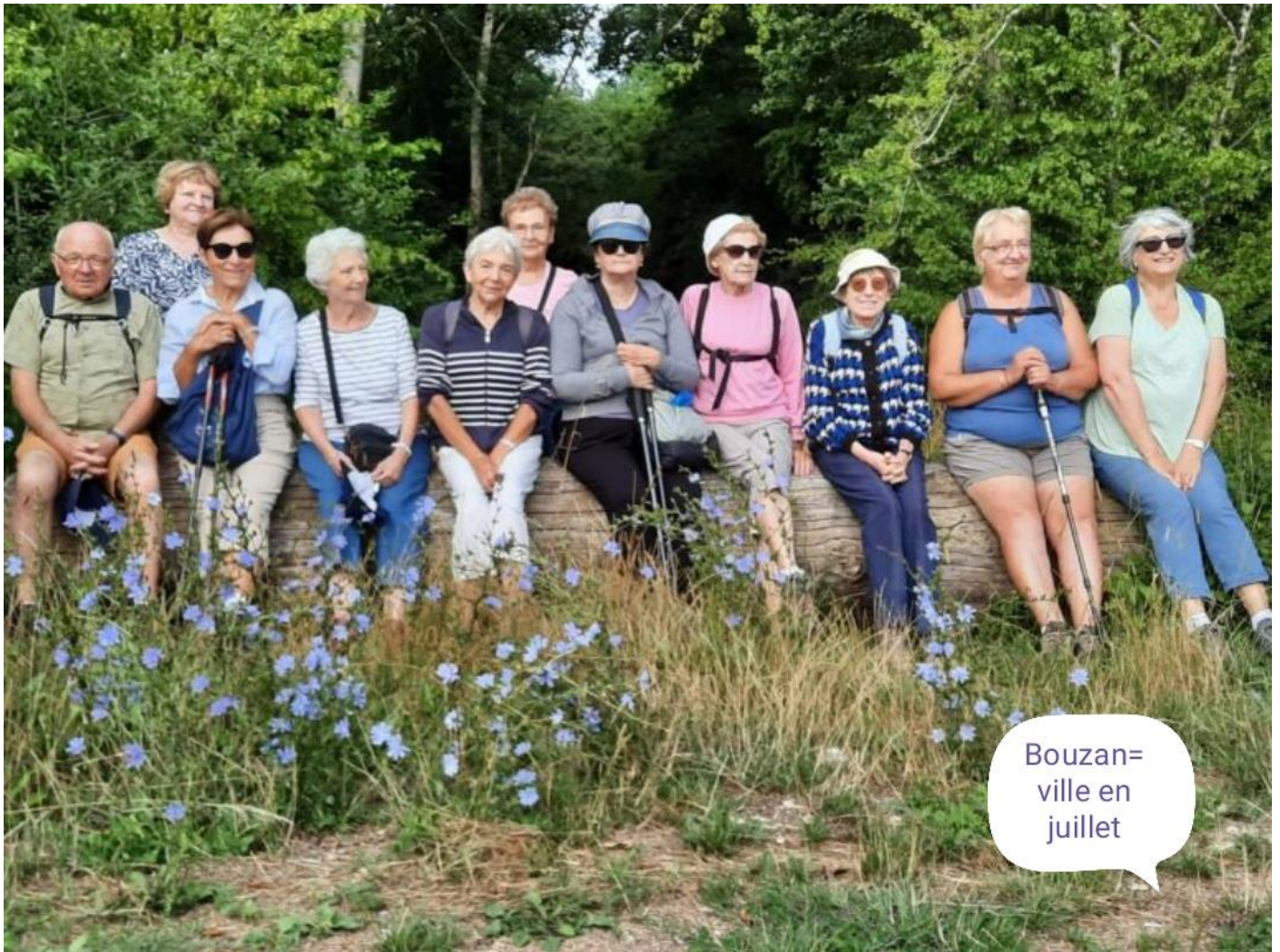
Bouzanville en juillet