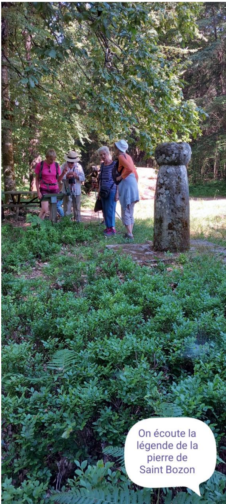
On écoute la légende de la pierre de Saint Bozon