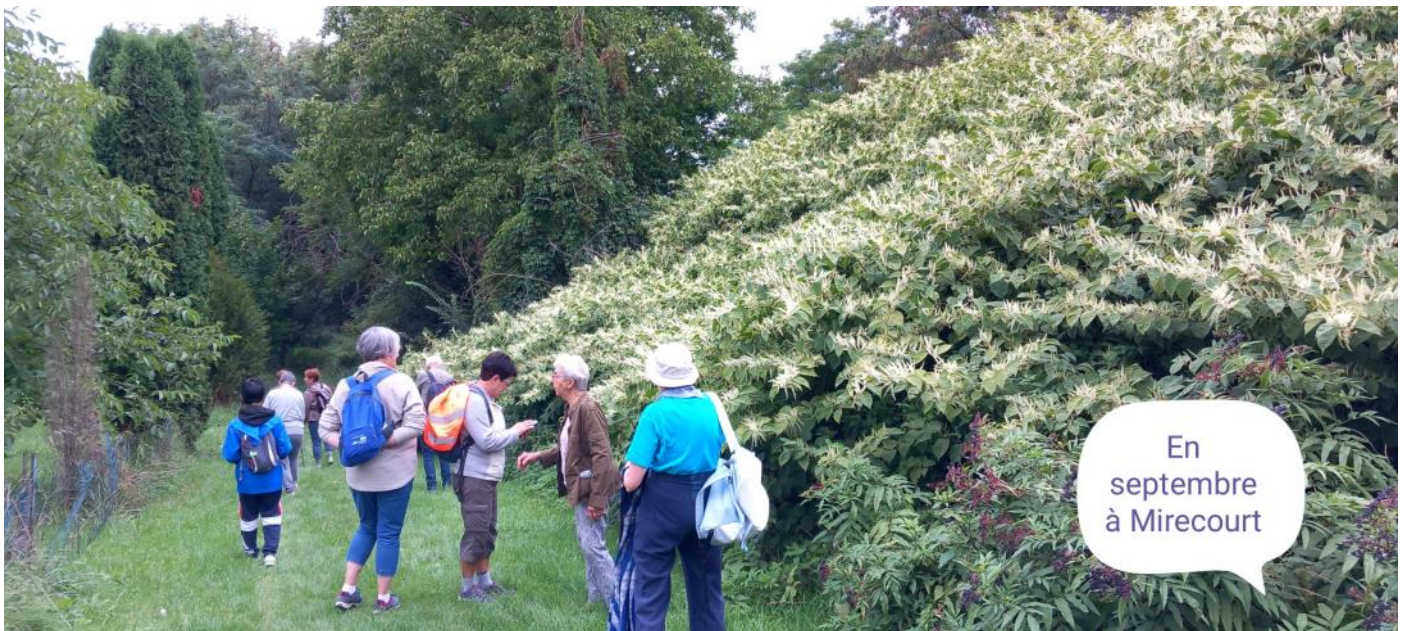
En septembre à Mirecourt