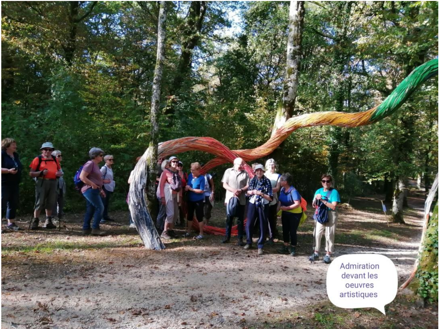
Admiration devant les oeuvres artistiques