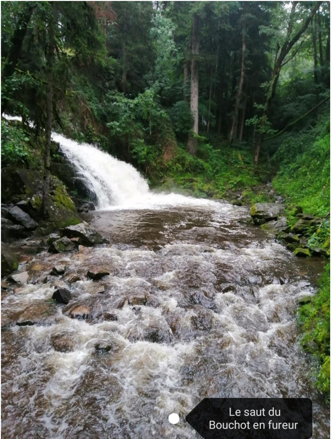
Le saut du Bouchot en fureur