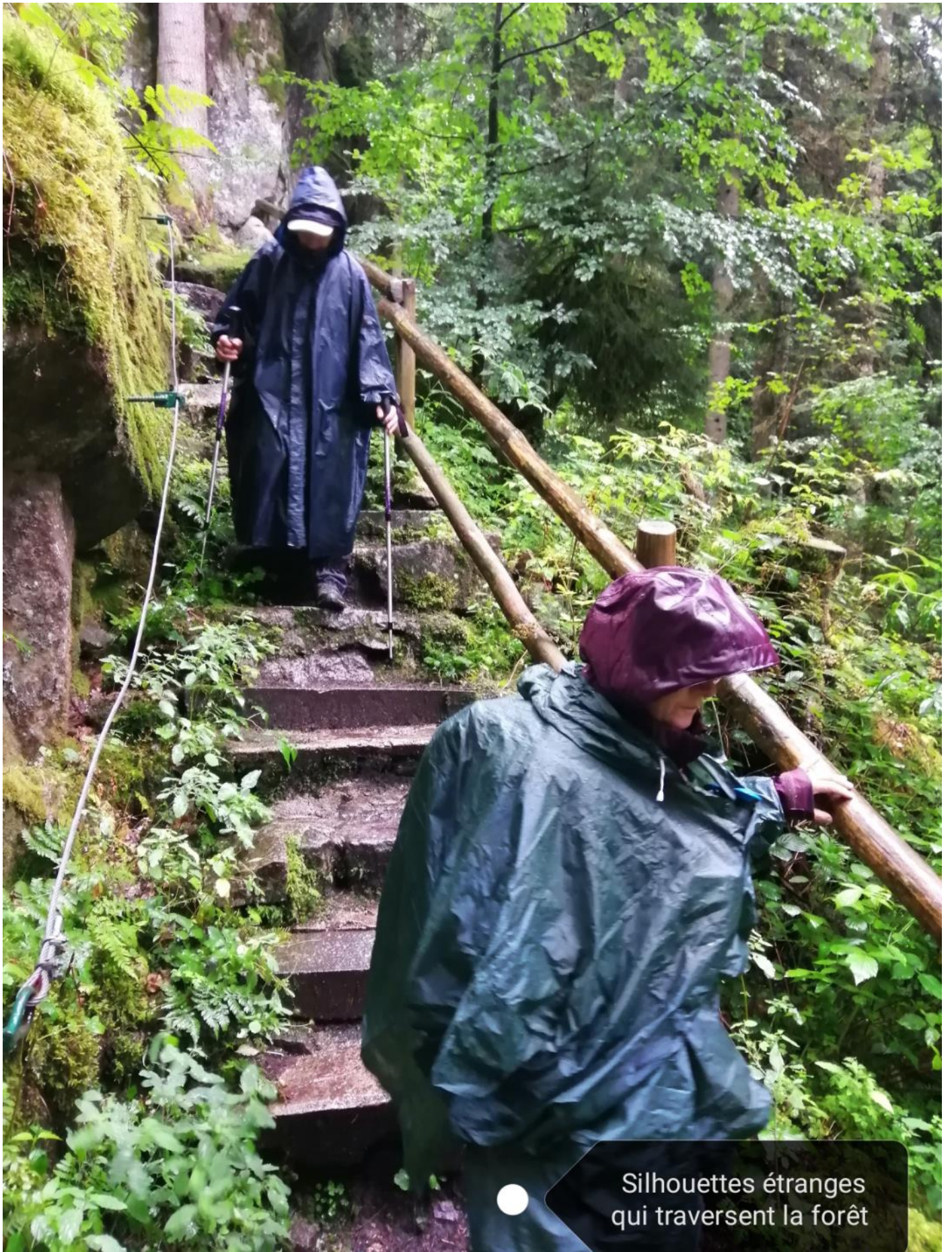
Silhouettes étranges qui traversent la forêt