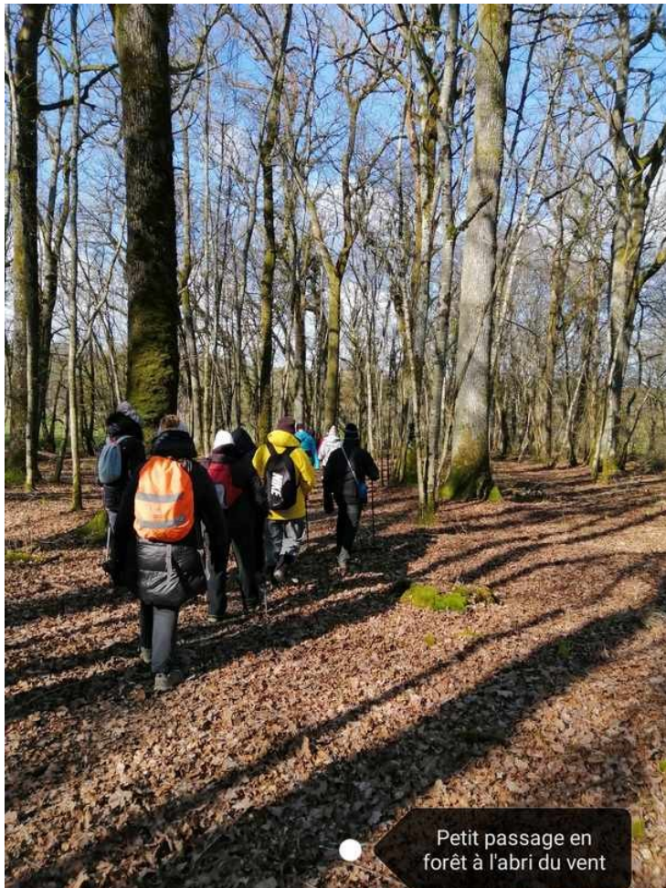
Petit passage en forêt à l'abri du vent