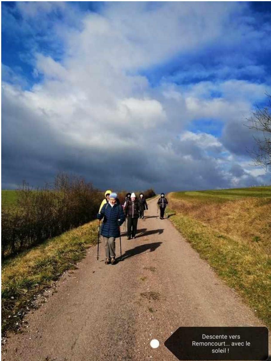
Descente vers Remoncourt... avec le soleil !