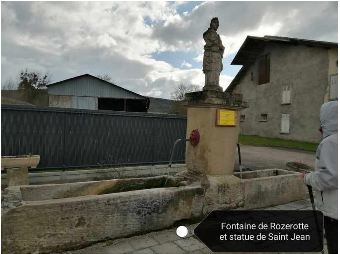
Fontaine de Rozerotte et statue de Saint Jean