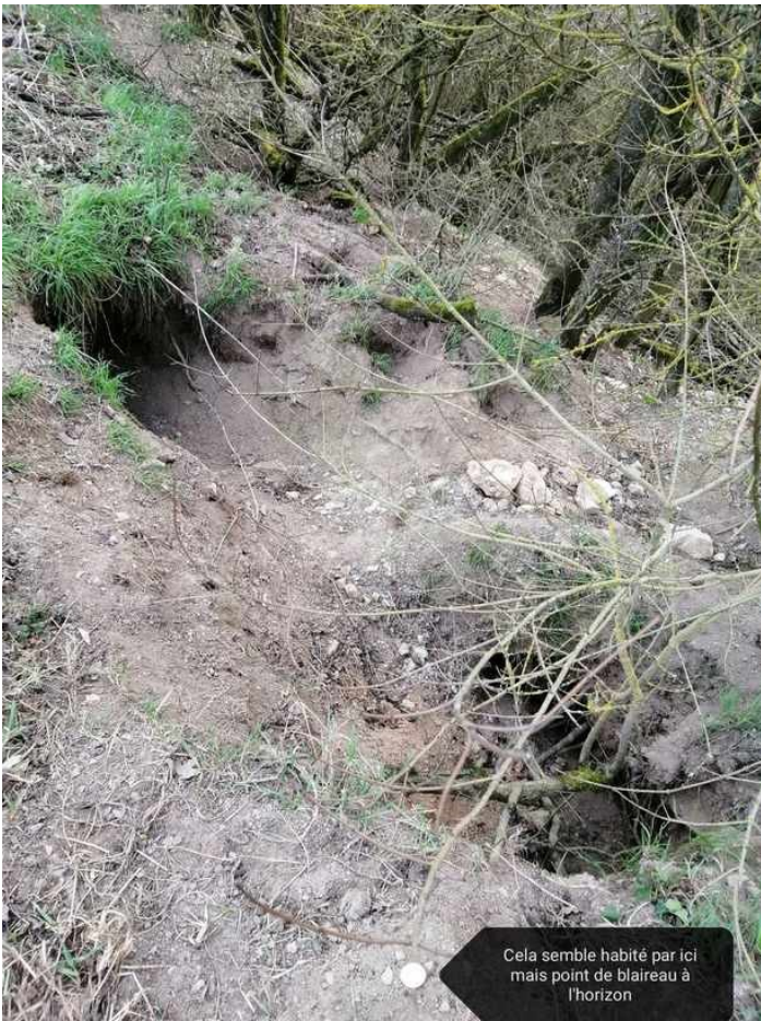
Cela semble habité par ici mais point de blaireau à l'horizon