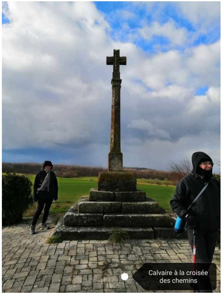
Calvaire à la croisée des chemins