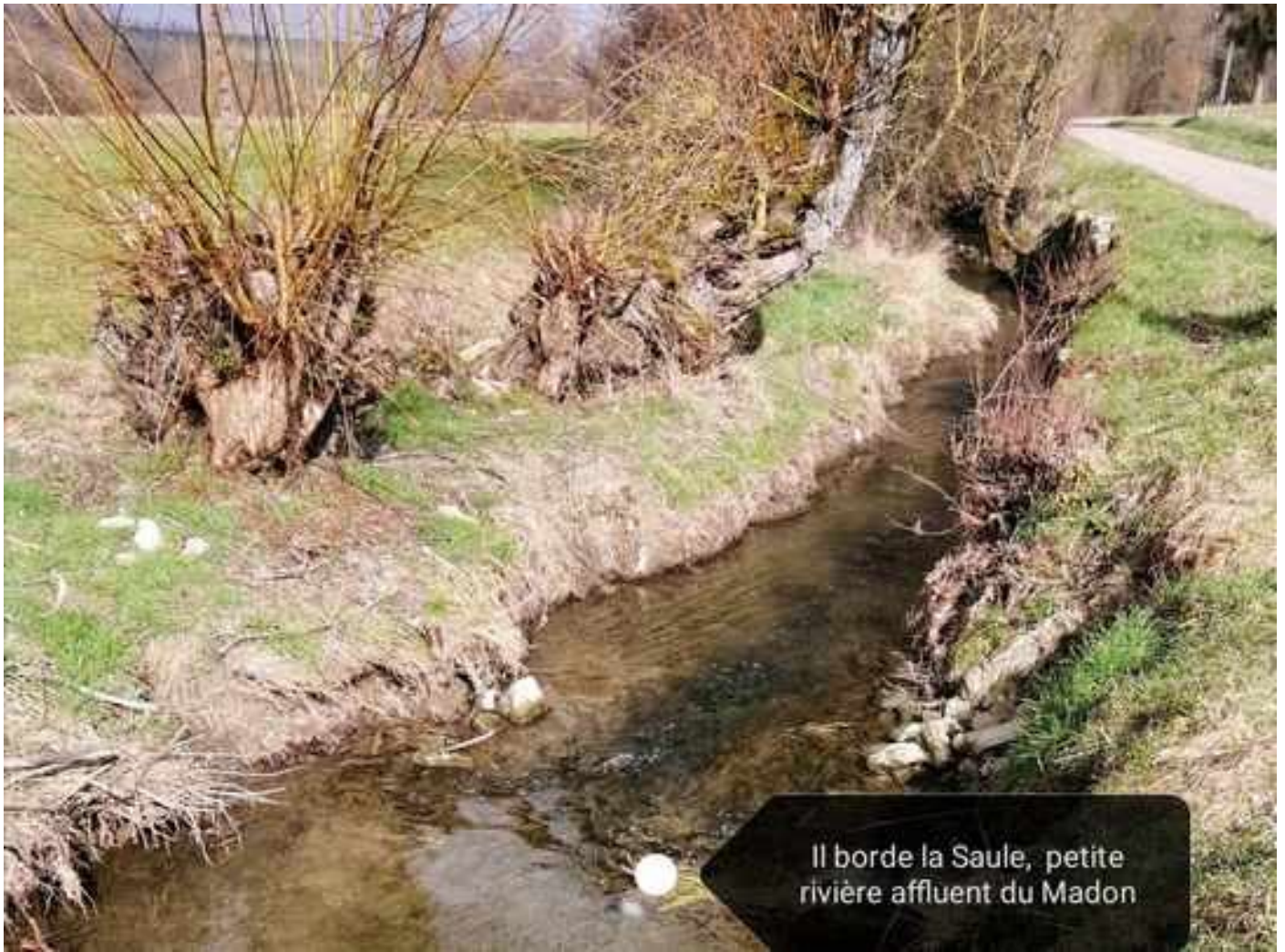
Il borde la Saule, petite rivière affluent du Madon