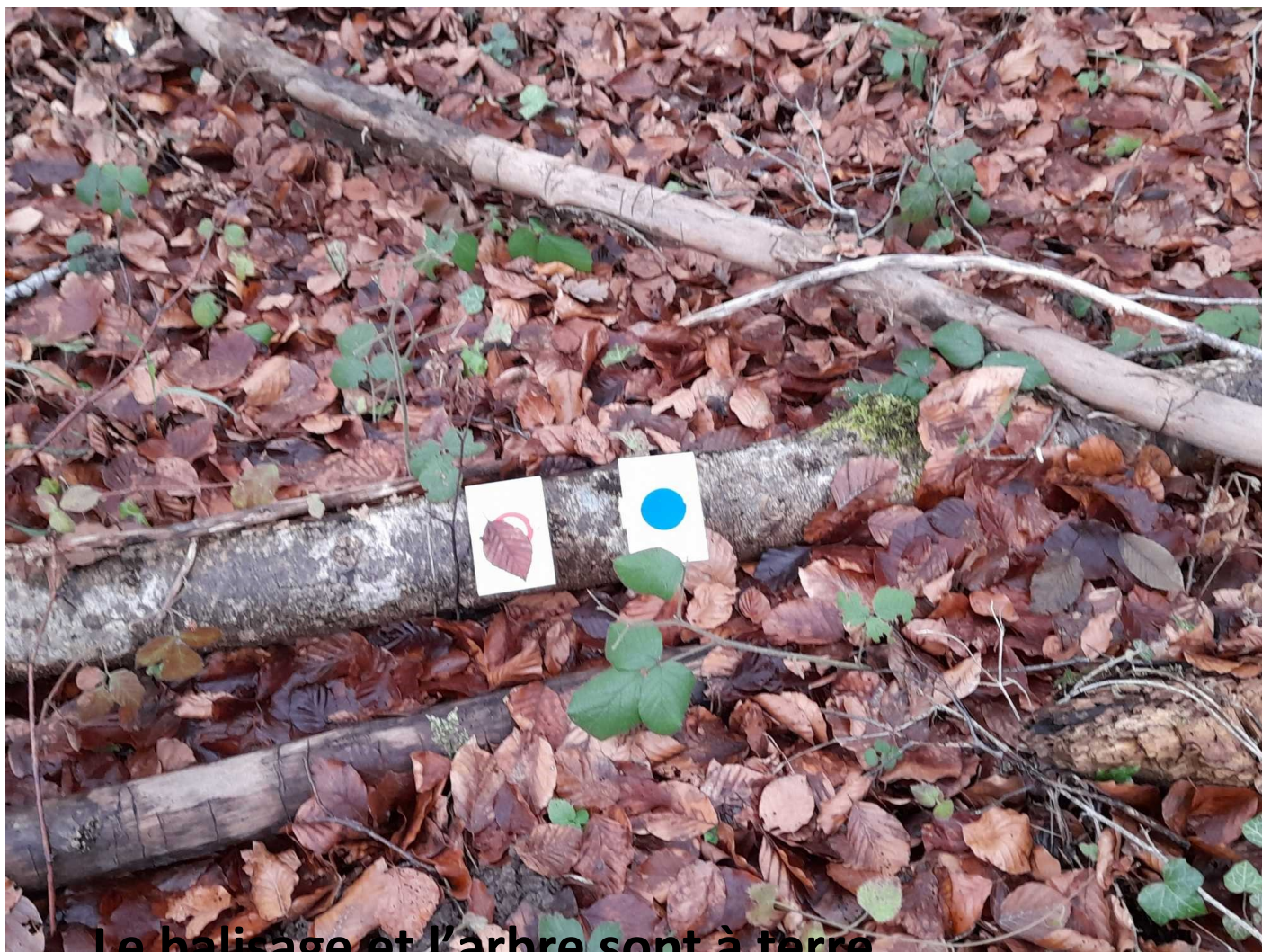
Le balisage et l'arbre sont à terre