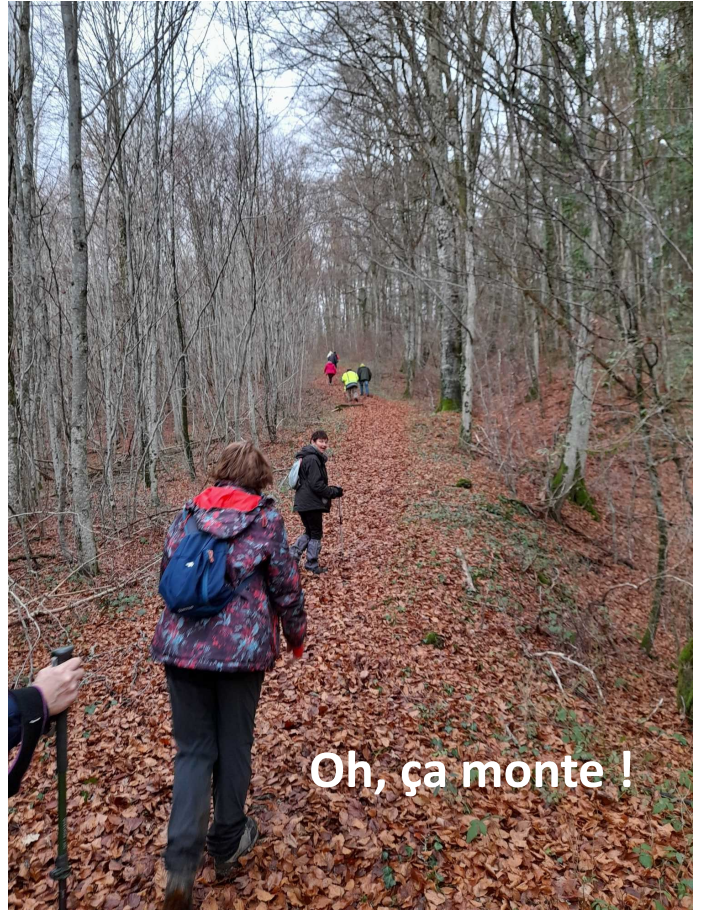
Oh, ça monte !