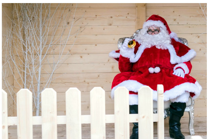
Les vitrines de Dompaire