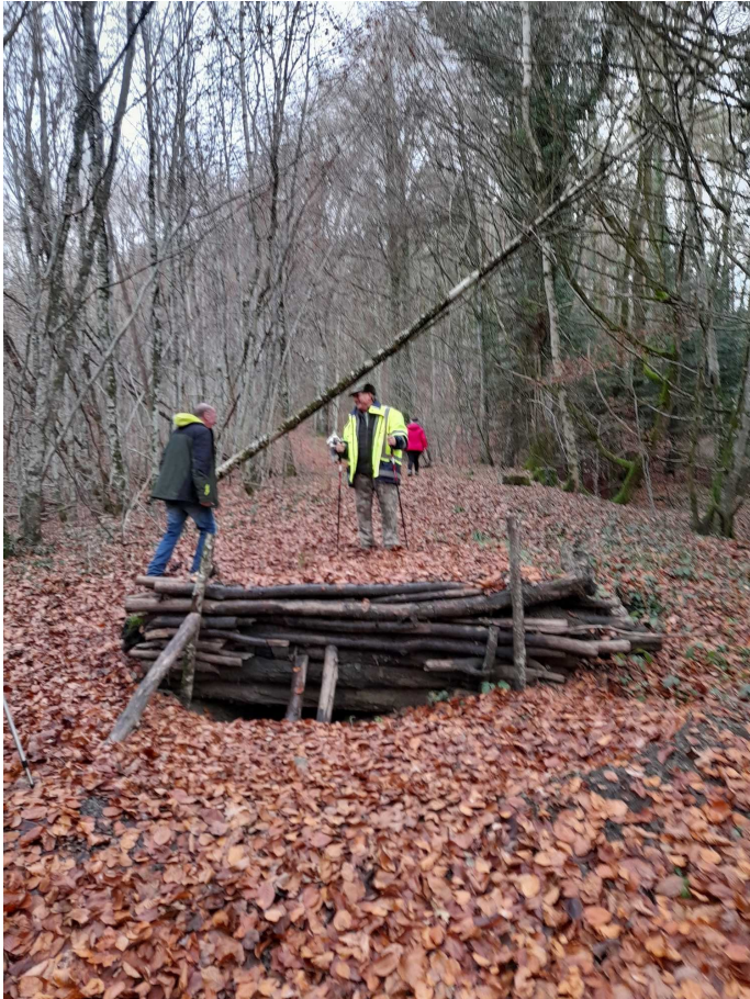
Tremplin pour les vélos !