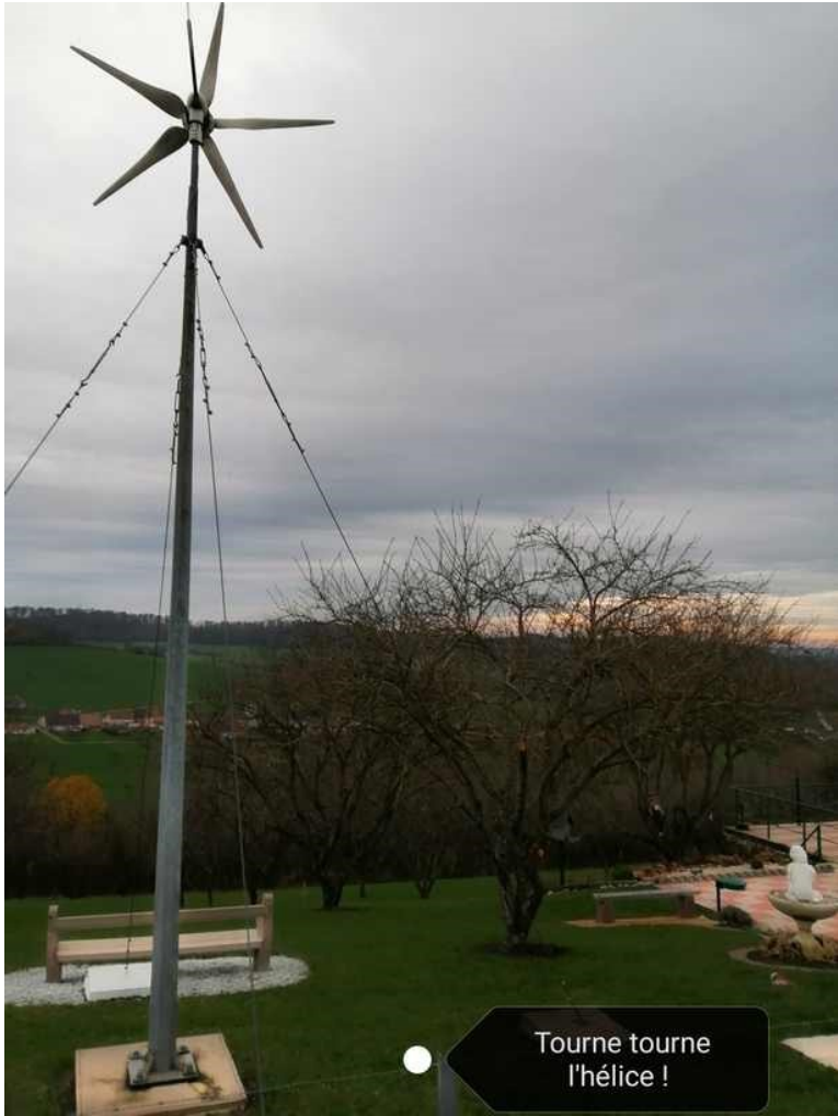
Tourne tourne l'hélice !