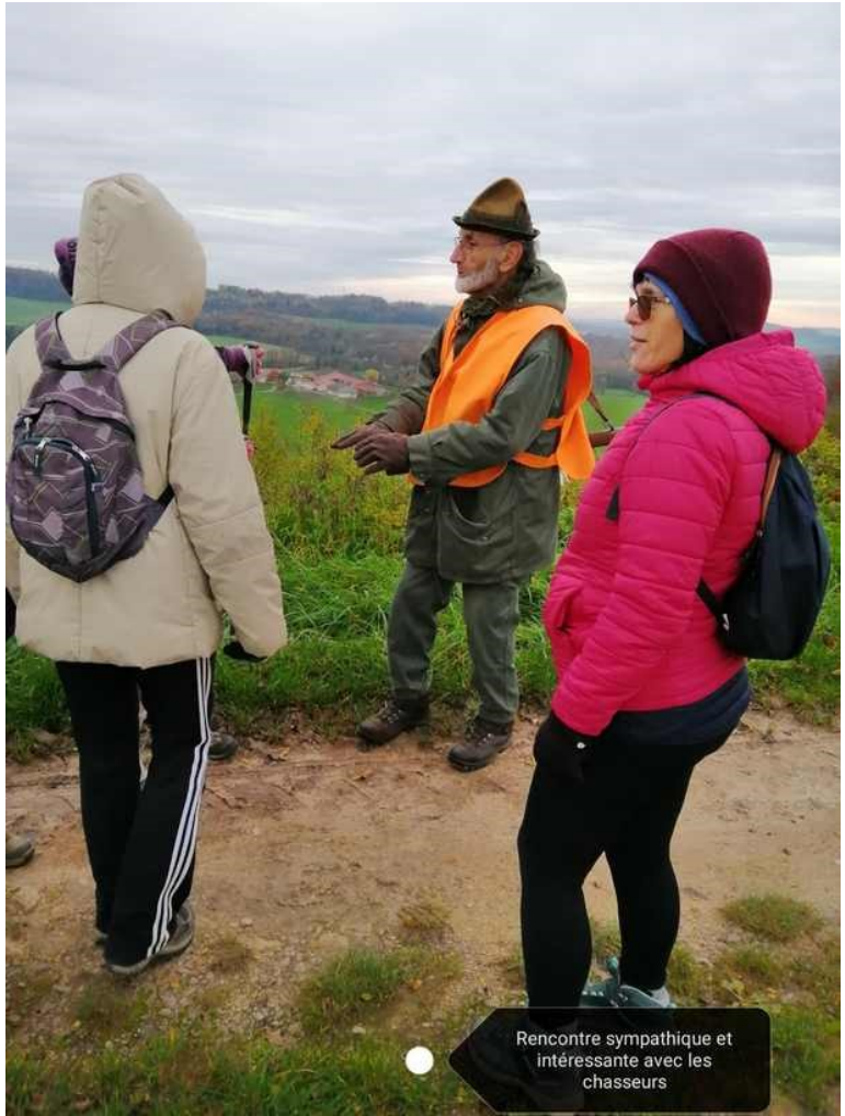
Rencontre sympathique et intéressante avec les chasseurs