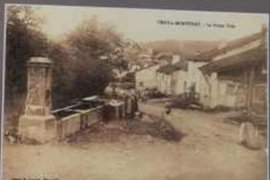
1888 - MONTPELLIER - rue de la Fontaine

Un jour, un ange protecteur des enfants, fit don à un moine d'une angelique sylvestre, appelée herbe à la fièvre, et lui en révéla les inestimables vertus : médicinales, protectrices, magiques... Portée autour du cou, l'Angelique protège contre tout maléfice et mauvais sort.