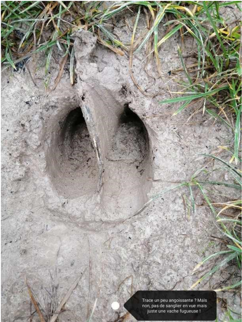
Trace un peu angoissante ? Mais non, pas de sanglier en vue mais juste une vache fugueuse !