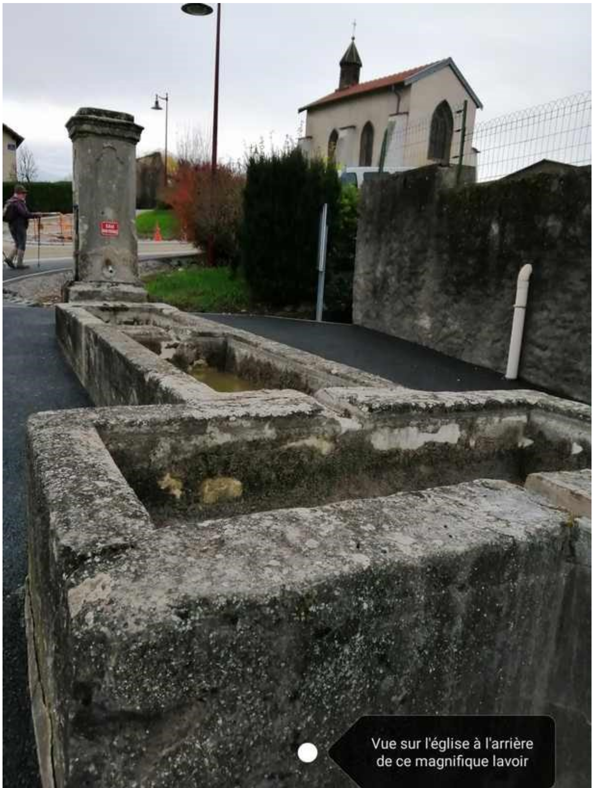
Vue sur l'église à l'arrière de ce magnifique lavoir