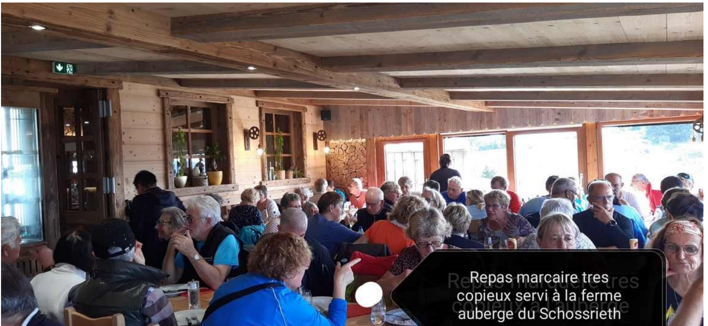
Repas maraîcher très copieux servi à la ferme auberge du Schossrieth