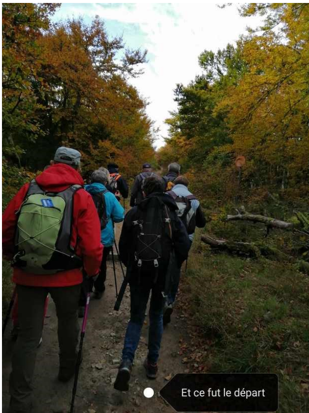
Et ce fut le départ