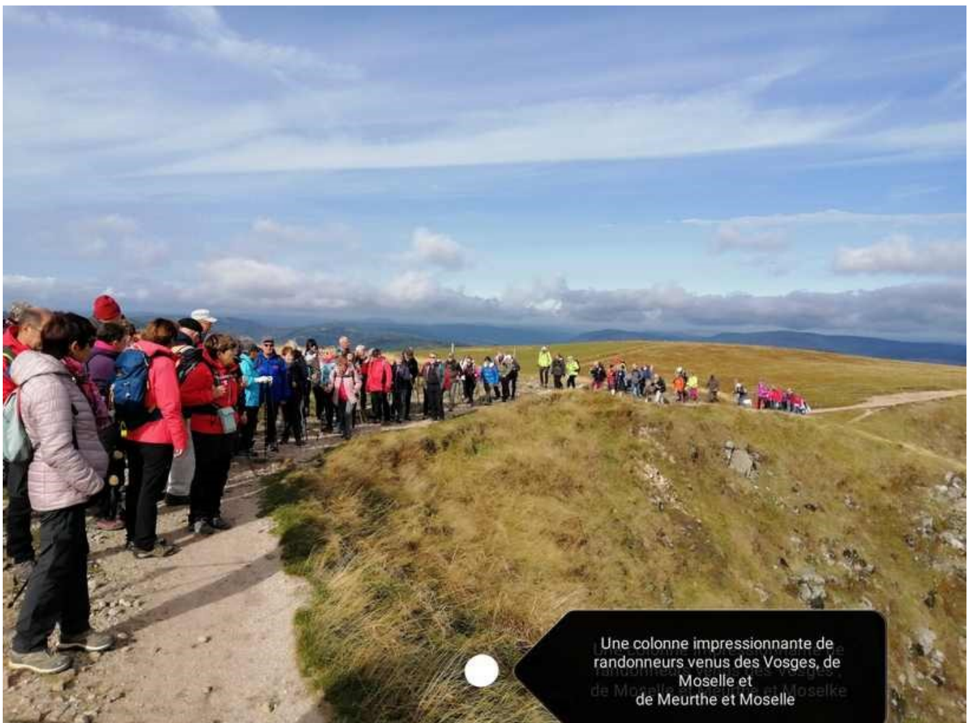
Une colonne impressionnante de randonneurs venus des Vosges, de Moselle et de Meurthe et Moselle