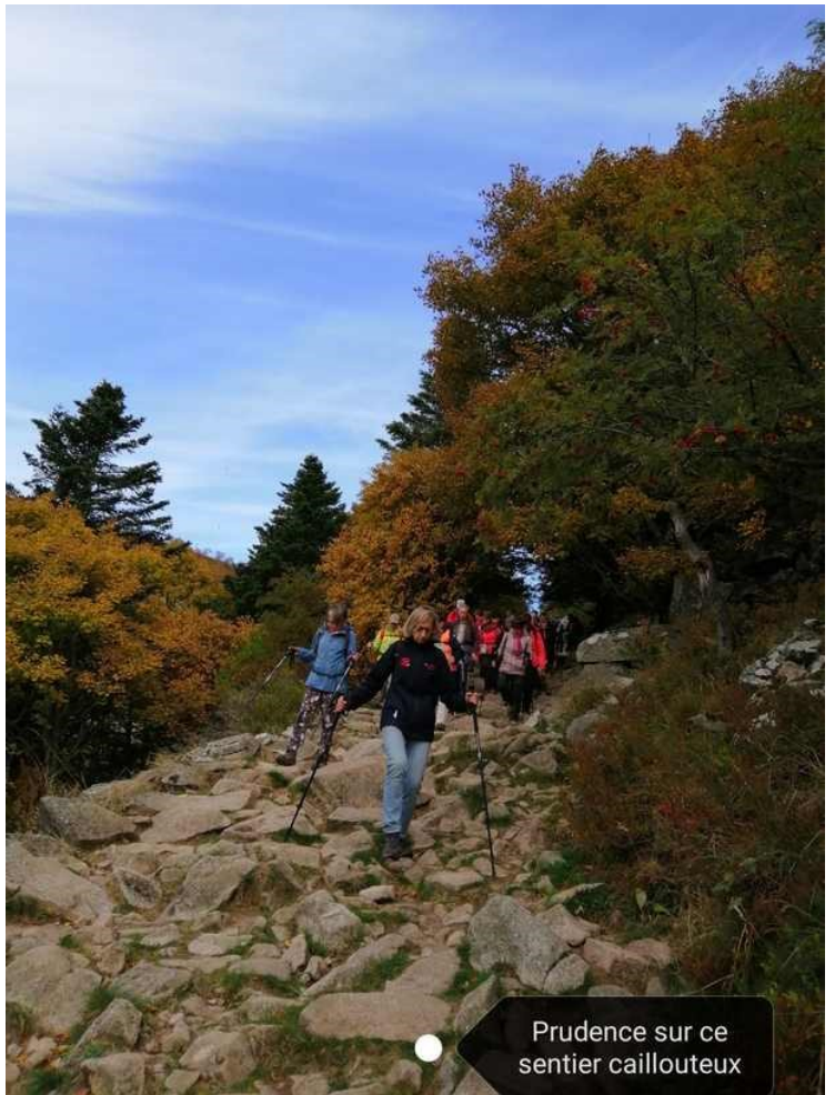
Prudence sur ce sentier caillouteux