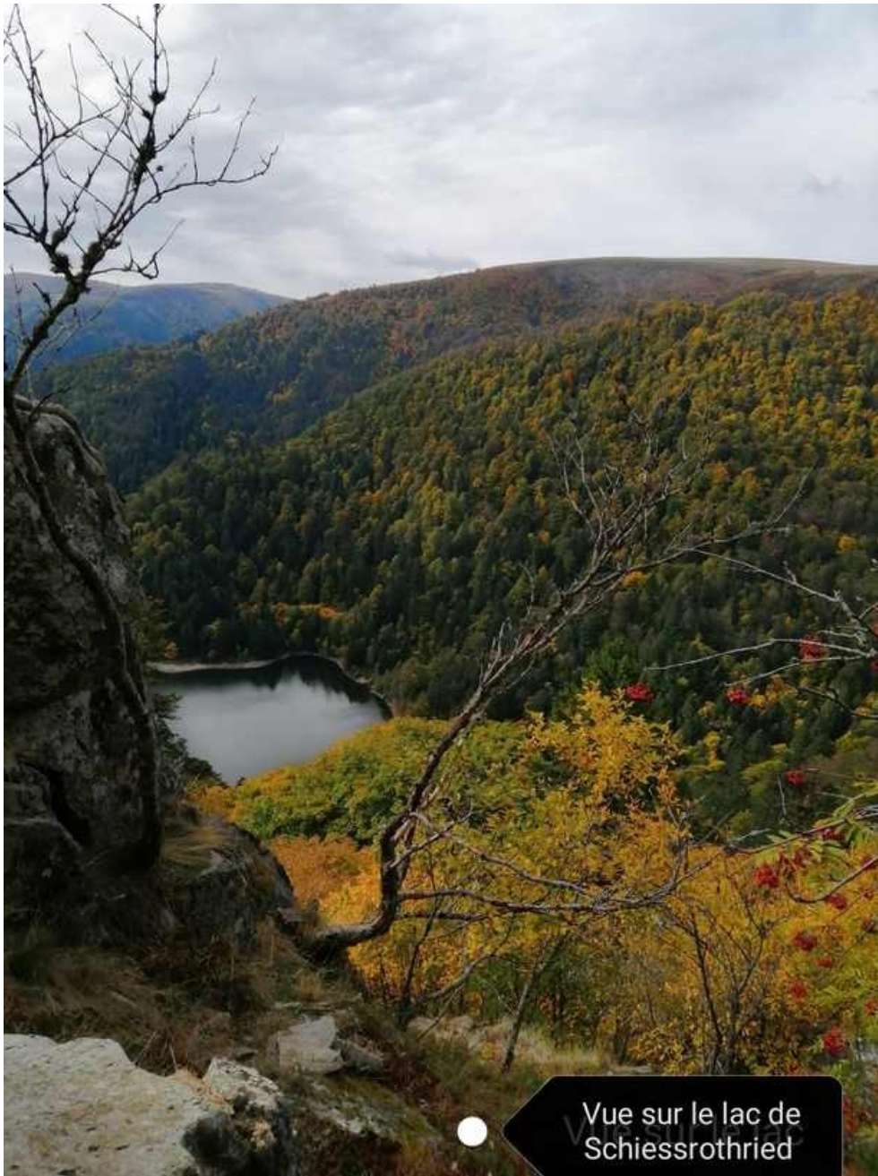
Vue sur le lac de Schiessrothried