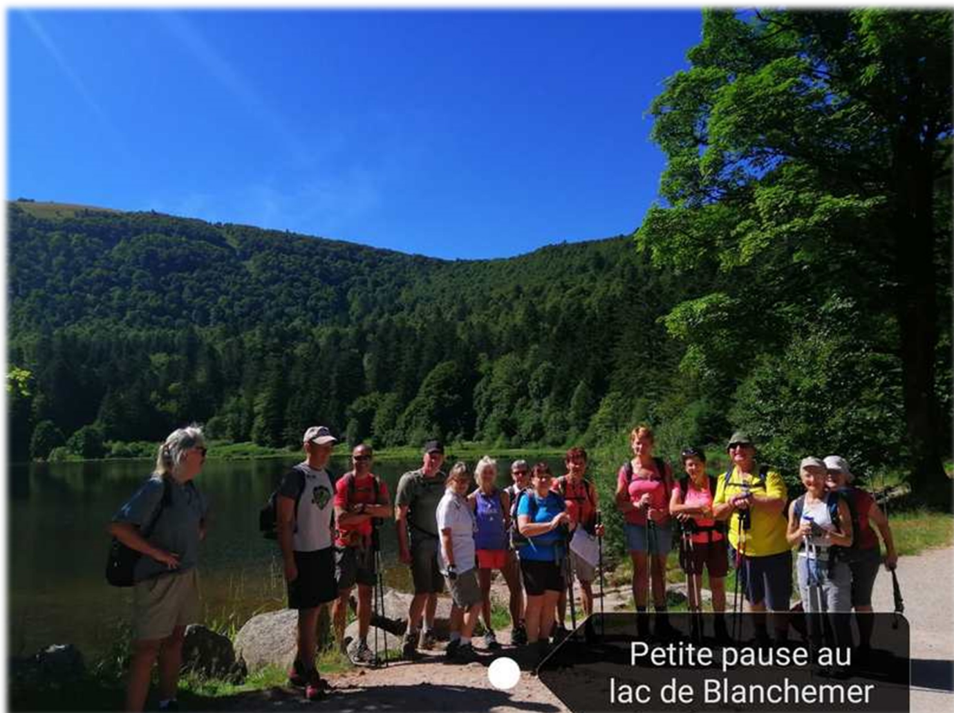
Petite pause au lac de Blanche