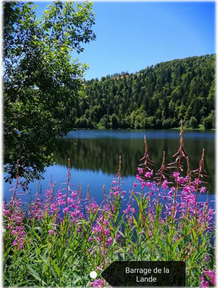
Barrage de la Lande