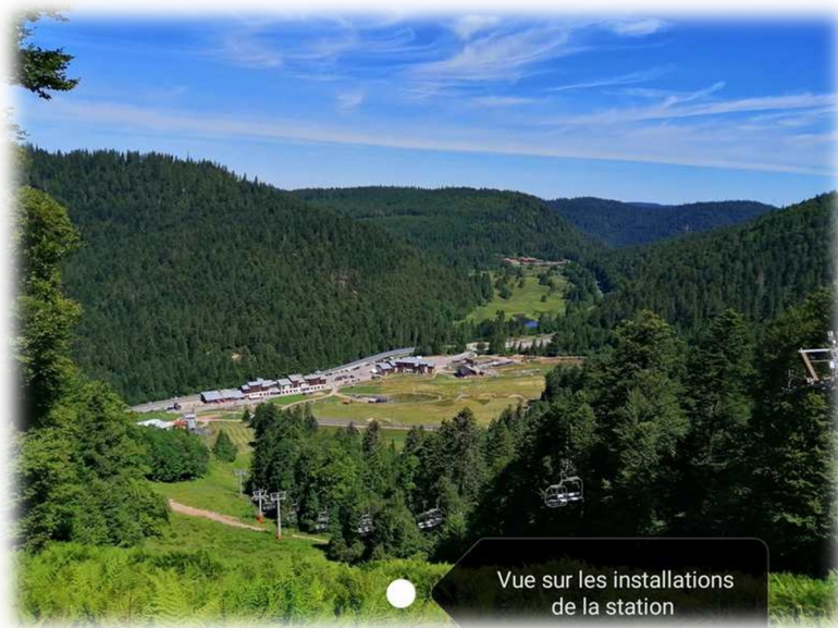
Vue sur les installations de la station