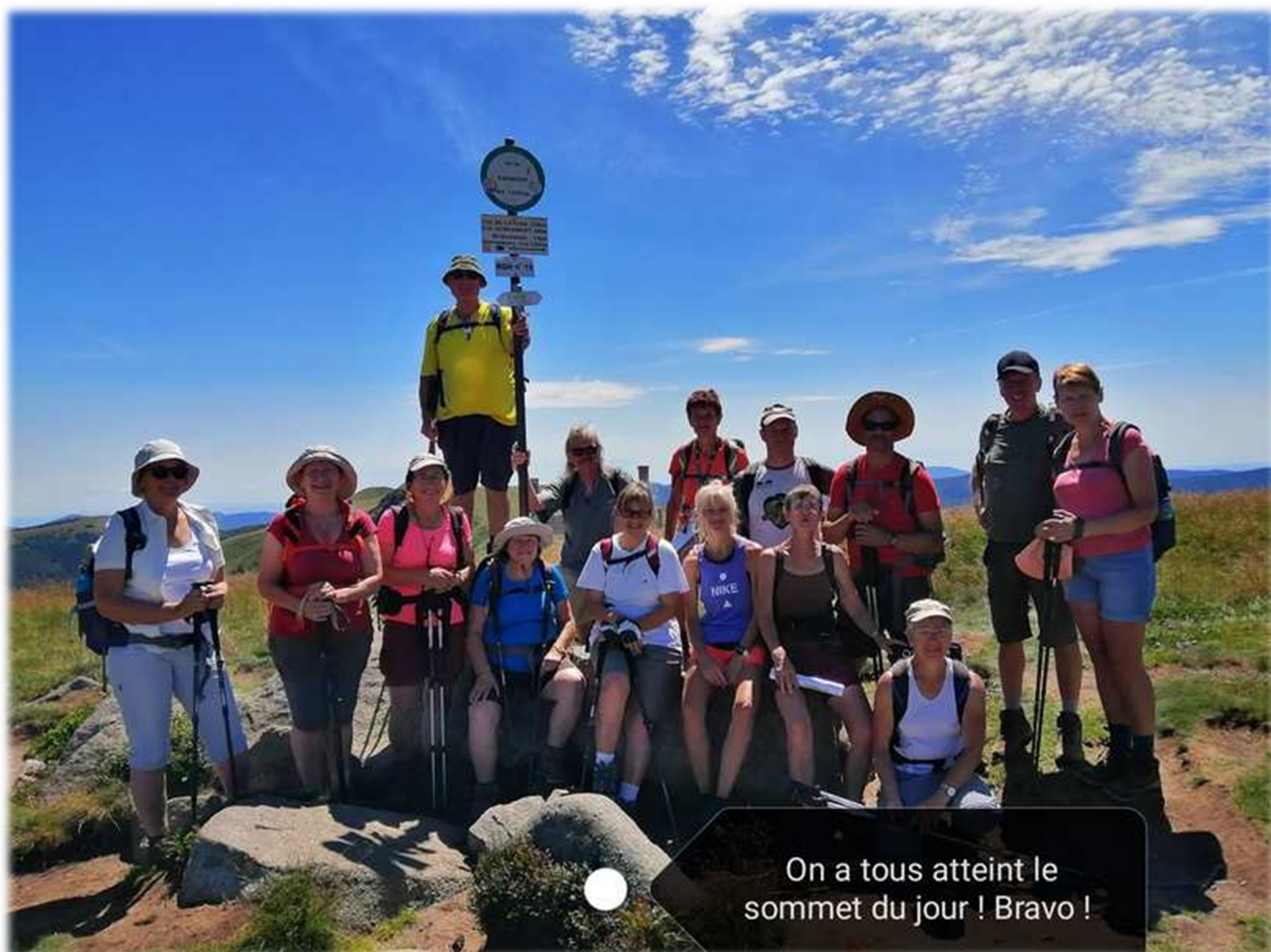
On a tous atteint le sommet du jour ! Bravo !

Culminant à 1 305 m, cette montagne borde la route des Crêtes ; elle est située entre le Kastelberg au nord et le Rothenbachkopf au sud. Elle est à cheval sur les communes de Metzeral, Wildenstein et La Bresse.