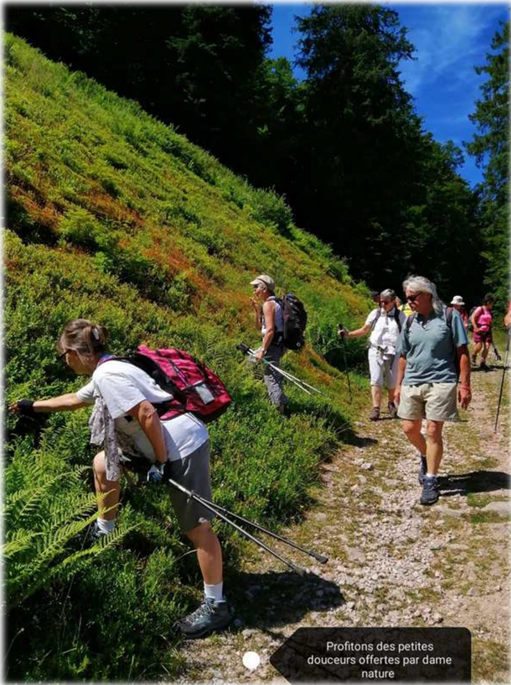
Profitions des petites douceurs offertes par dame nature