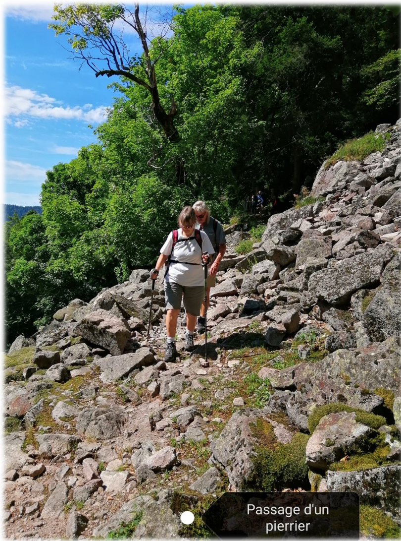
Passage d'un pierrier