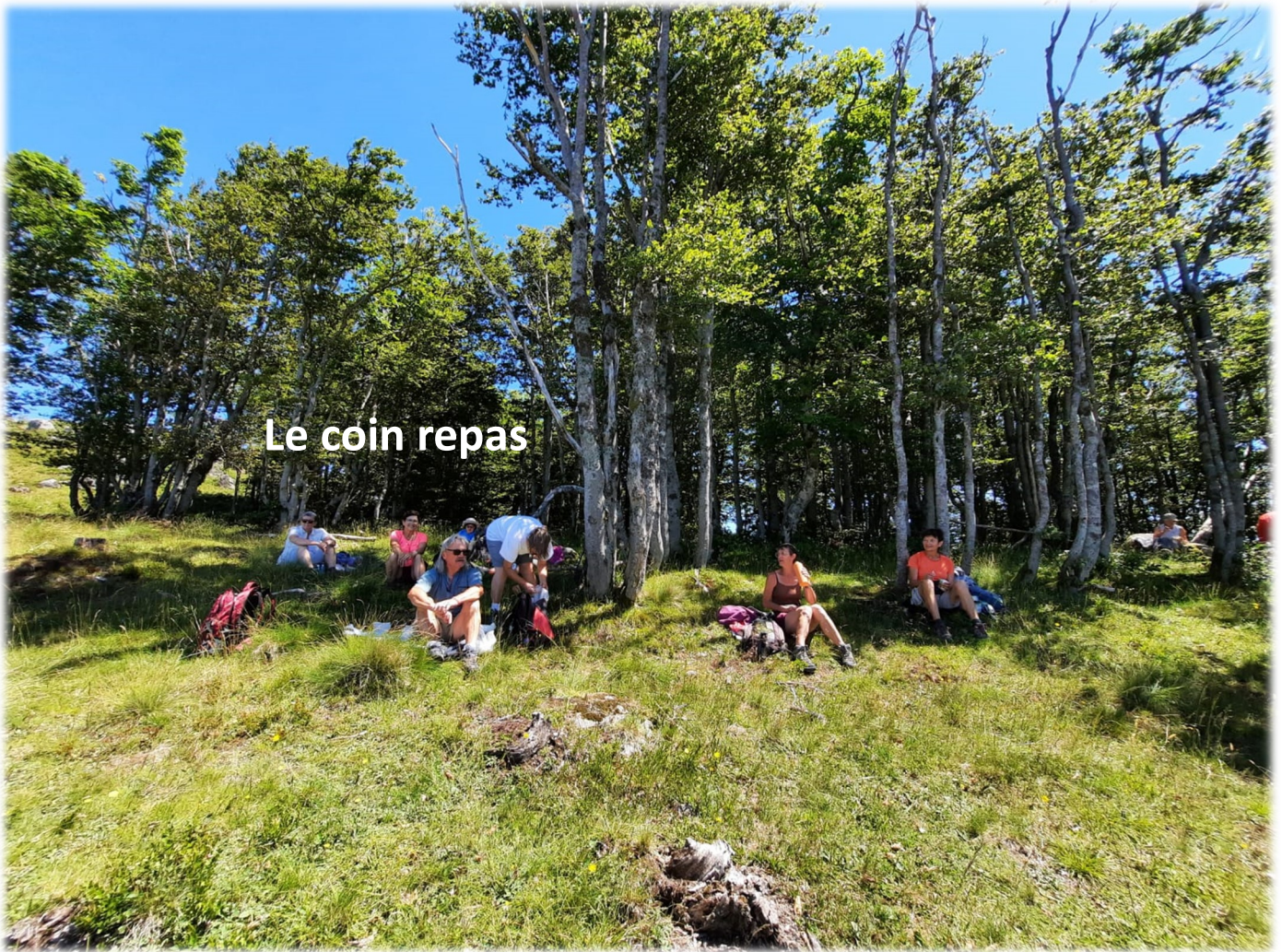
Le coin repas