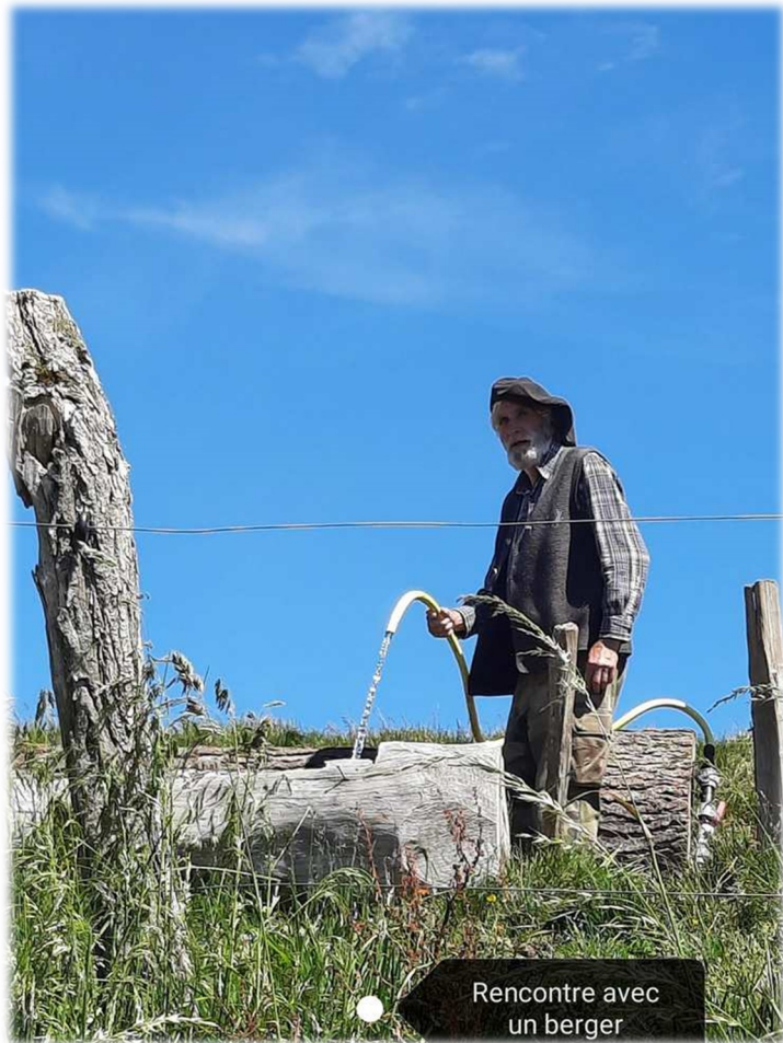
Rencontre avec un berger

Le Rainkopf est un sommet du massif des Vosges situé quatre kilomètres au sud du Hohneck .